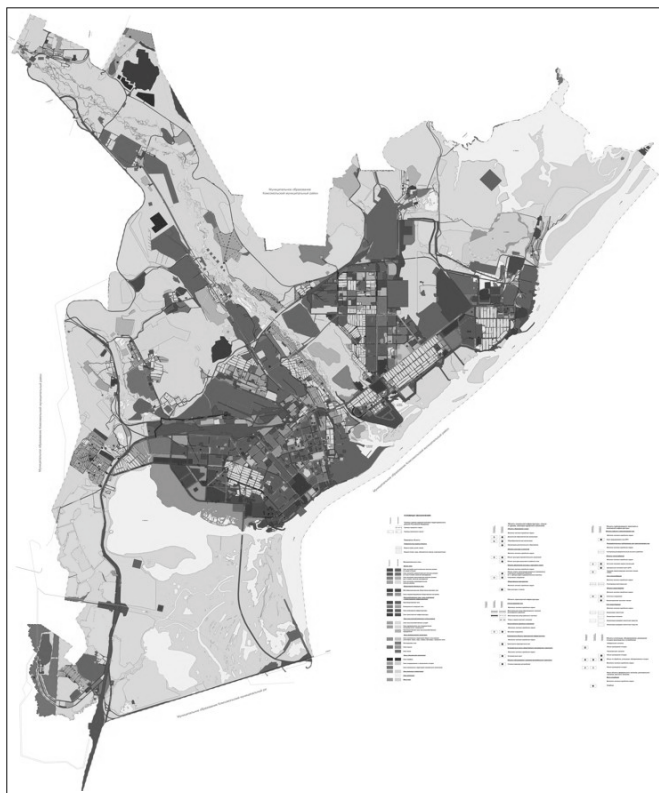
ПРИЛОЖЕНИЕ 2 к решению Комсомольской-на-Амуре городской Думы от 20.11.2024 № 170 КАРТА ГРАНИЦ ГОРОДА КОМСОМОЛЬСКА-НА-АМУРЕ