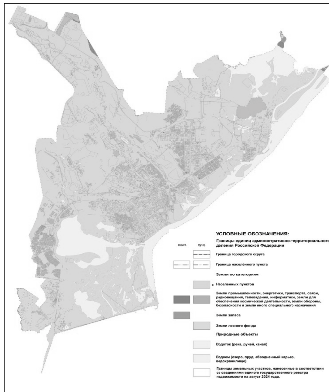
ПРИЛОЖЕНИЕ 3 к решению Комсомольской-на-Амуре городской Думы от 20.11.2024 № 170 КАРТА ФУНКЦИОНАЛЬНЫХ ЗОН ГОРОДА КОМСОМОЛЬСКА-НА-АМУРЕ