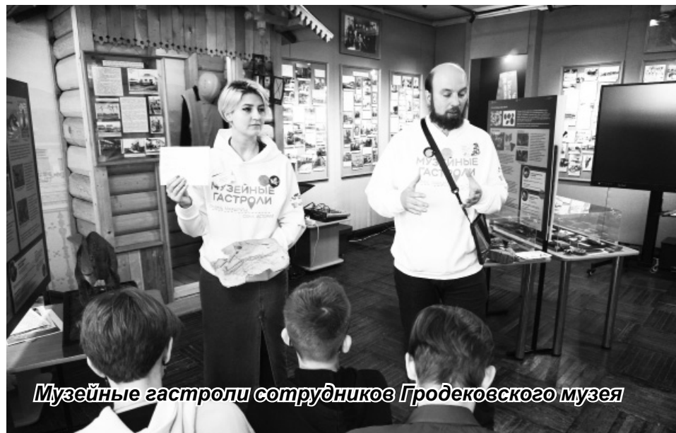
Музейные гастроли сотрудников Гродековского музея

Отделочные работы резьбой по дереву украсили внешний и внутренний вид здания. Здание музея стало выглядеть как усадьба 19 века. Незаметно для посетителей пройдут еще три ремонта, которые были сделаны при участии сотрудников музея: это экспозиции второго этажа, ремонт в зале войны, ремонт в кабинете фондовиков и гордость музея – мраморная, винтовая лестница.