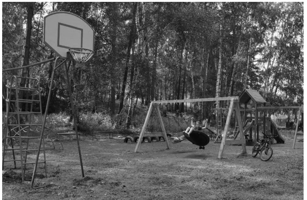
Благодарим жителей Тахтинского сельского поселения за неравнодушие и личный вклад в совершенствование родного поселка!

Реализация подобных инициатив рождается при взаимодействии органов власти и населения. Ведь именно население определяет, что необходимо для благоустройства территории, где оно проживает. Это же мнение не раз выражал и врио губернатора Хабаровского края Дмитрий Демешин.