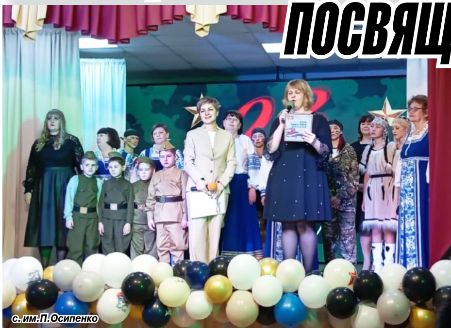
с. им. П. Осипенко

В преддверии Дня защитника Отечества в районе имени Полины Осипенко прошли патриотические мероприятия. Благотворительные концерты, мастер-классы, игровые программы и тематические встречи объединили жителей всех поселений - от райцентра до отдаленных сел. Взрослые и дети, артисты и зрители, школьники и ветераны вместе говорили о мужестве, чести и любви к Родине