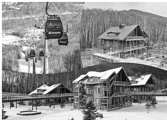
КОЛЛАЖ: ЕВГЕНИЙ АЛЕКСЕЕВ

ЧЕБУРАШЕК ВОЕННОСЛУЖАЩИЕ МОГУТ НОСИТЬ С СОБОЙ НА ПОЯСНЫХ РЕМНЯХ, РЮКЗАКАХ, В НАГРУДНЫХ КАРМАНАХ.