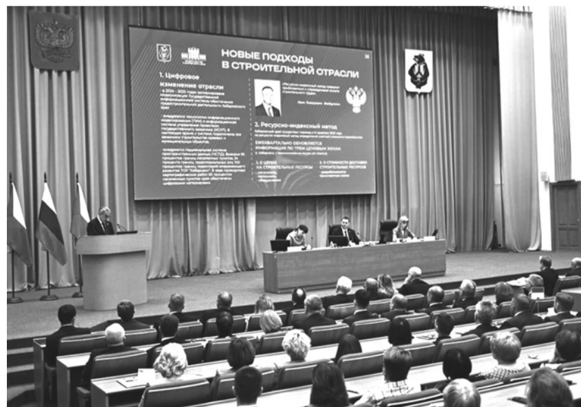
Расширенное заседание правительства края.

По материалам пресс-службы Правительства Хабаровского края.