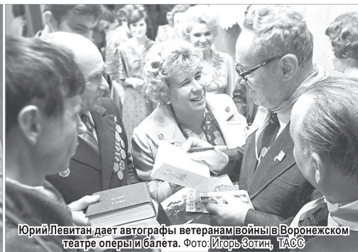
Юрий Левитан дает автографы ветеранам войны в Воронежском театре оперы и балета.