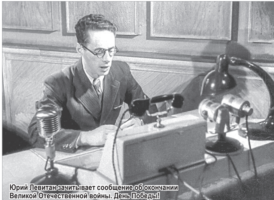
Юрий Левитан зачитывает сообщение об окончании Великой Отечественной войны. День Победы!

О чередная встреча библиотеки с обитателями Дома-интерната с. Иннокентьевка была приурочена к 79-й годовщине Победы в Великой Отечественной войне.