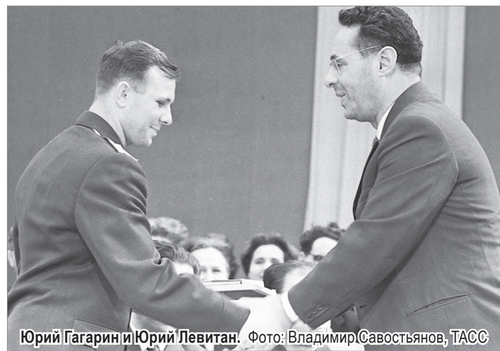
Юрий Гагарин и Юрий Левитан.