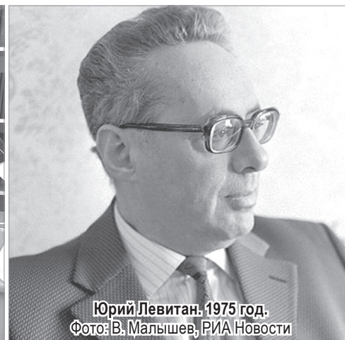
Юрий Левитан, 1975 год.