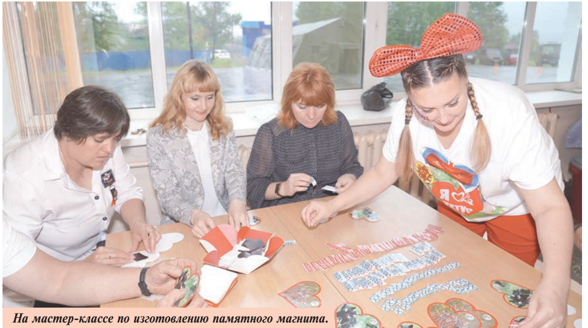
На мастер-классе по изготовлению памятного магнита.