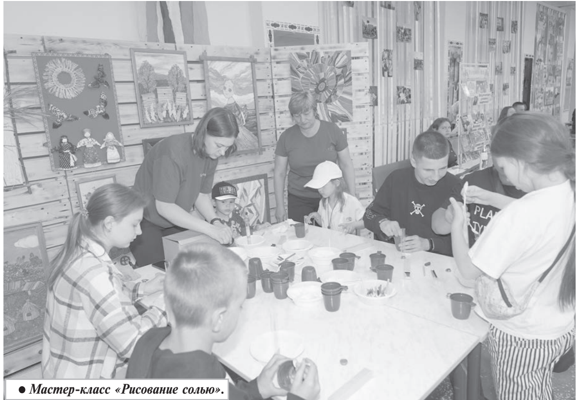
● Мастер-класс «Рисование солью».