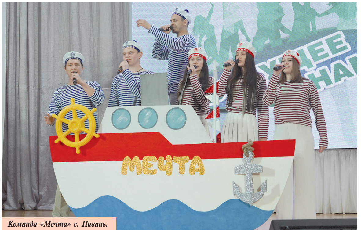
Команда «Мечта» с. Пивань.