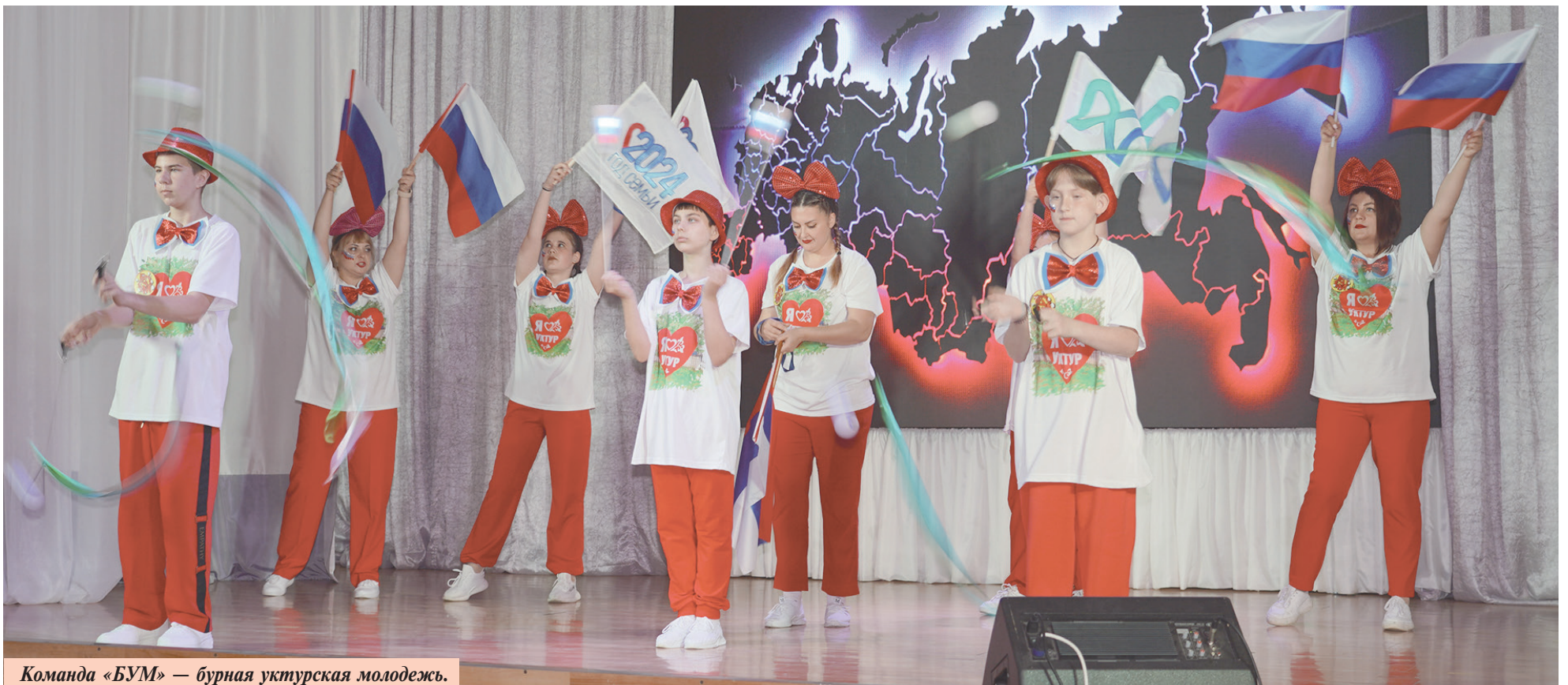
Команда «БУМ» — бурная уктурская молодежь.