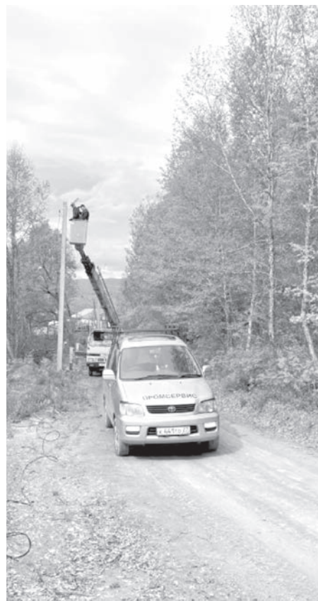
В селе Верхняя Эконь завершена реализация проекта «Да будет свет!».

Вопрос с уличным освещением на территории ТСО «Школьный» стоял остро. Отсутствие освещения доставляло местным жителям дискомфорт.