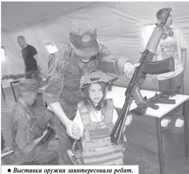
● Выставка оружия заинтересовала ребят.

А. МАКАРОВА, главный специалист отдела культуры администрации района.