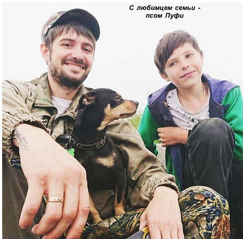
С любимцем семьи - псом Пуфи