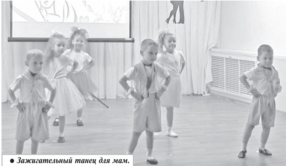
● Зажигательный танец для мам.

В детском саду «Мозаика» сельского поселения «Село Хурба» стало доброй традицией проводить мероприятия, посвященные Дню матери. Самые маленькие воспитанники детского сада записали видеопоздравления с песнями и танцами для любимых мамочек.