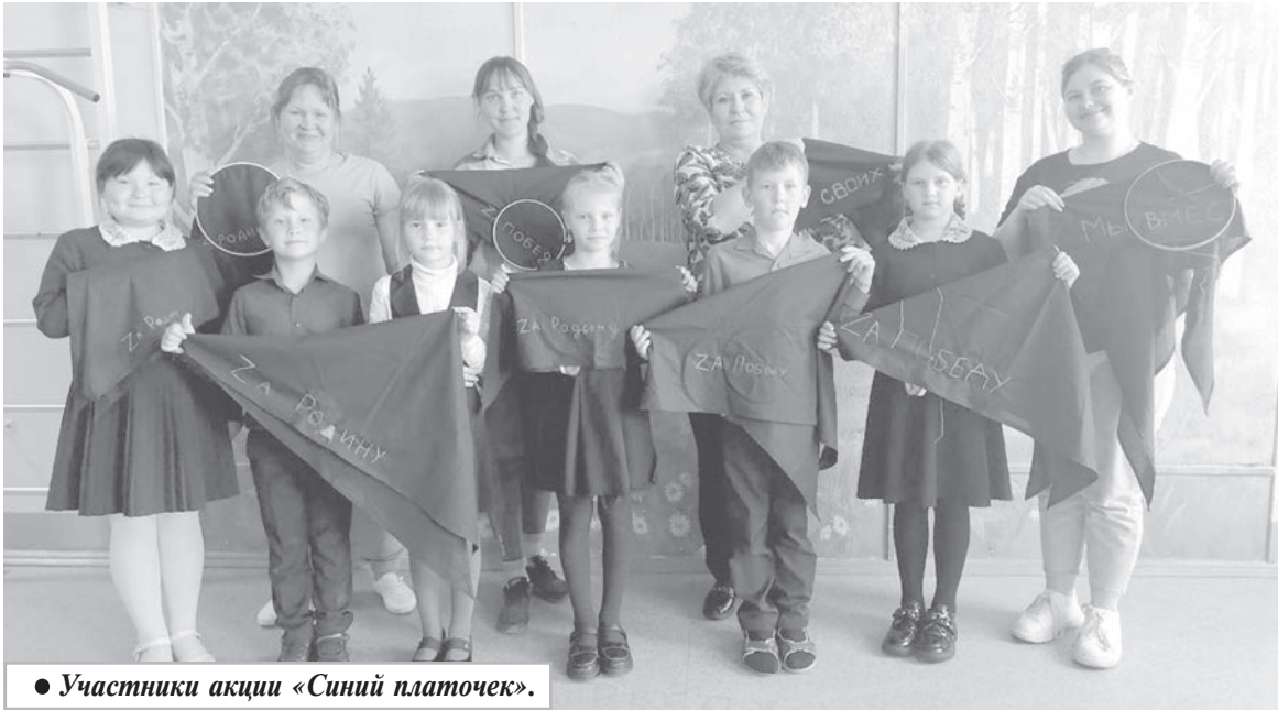
● Участники акции «Синий платочек».