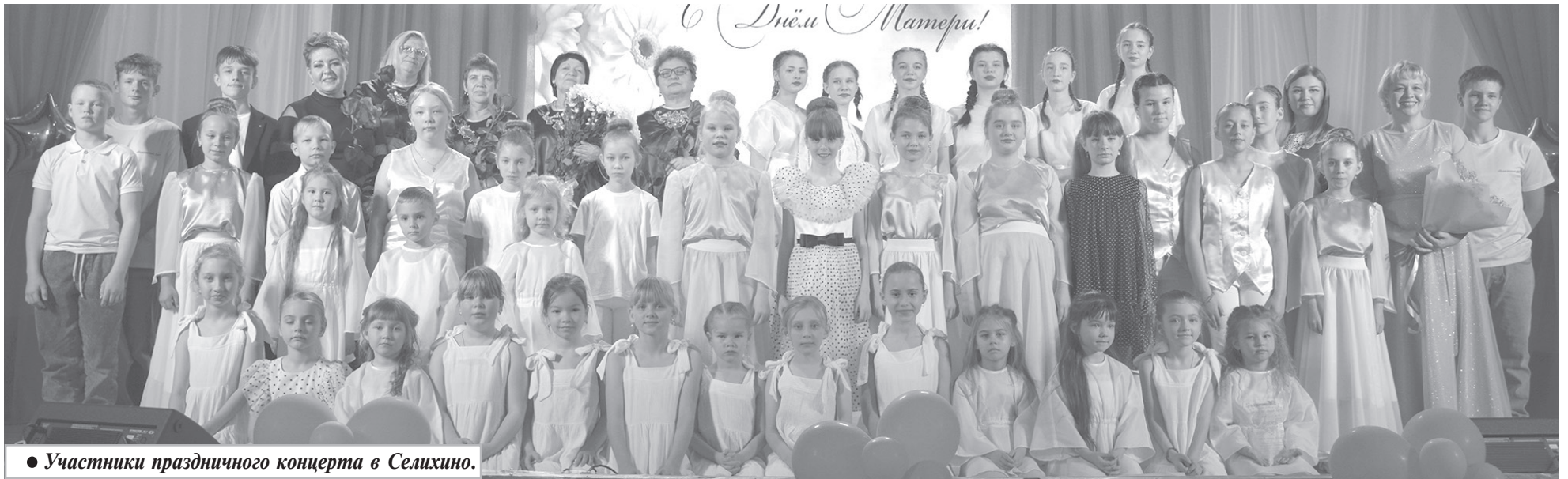
● Участники праздничного концерта в Селихино.

День матери — особенный праздник, посвященный тем, кто дарит нам жизнь, заботу и безграничную любовь. И сколько бы хороших, добрых слов не было сказано мамам, лишними они никогда не будут.