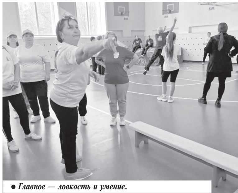
● Главное — ловкость и умение.

25 октября 2024 года на базе средней школы села Новый Мир состоялась очередная 13-я районная спартакиада ветеранов, посвященная 86-й годовщине образования Хабаровского края. Она была организована Комсомольским районным Советом ветеранов войны и труда при поддержке специалистов отдела по молодежной политике и спорта администрации Комсомольского муниципального района.