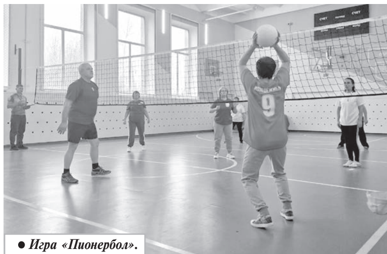
● Игра «Пионербол».

Самой большой популярностью у ветеранов пользуется игра «Пионербол». И как результат — все команды, прибывшие на спартакиаду, активно приняли участие в ней. Команды проявили упорство, спортивный азарт и волю к победе.