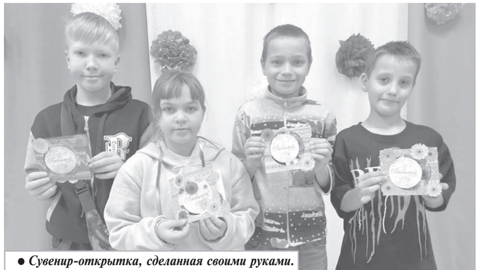
● Сувенир-открытка, сделанная своими руками.

В преддверии самого светлого и доброго праздника Дня матери в Доме культуры села Пивань были организованы различные мероприятия.