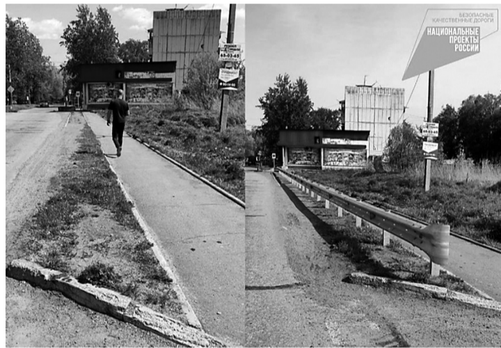
Подъезд к с. Калининка (до и после ремонта)

На средства предоставленной краевой субсидии уже обустроена пешеходная дорожка на автодороге на средства предоставленной субсидии. Также на завершающем этапе находится работа по устройству