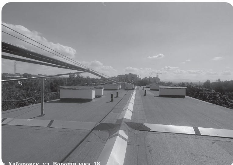
Хабаровск, ул. Ворошилова, 18

ния, теплоснабжения, электро-снабжения, а также установку приборов учета, ремонта подва-