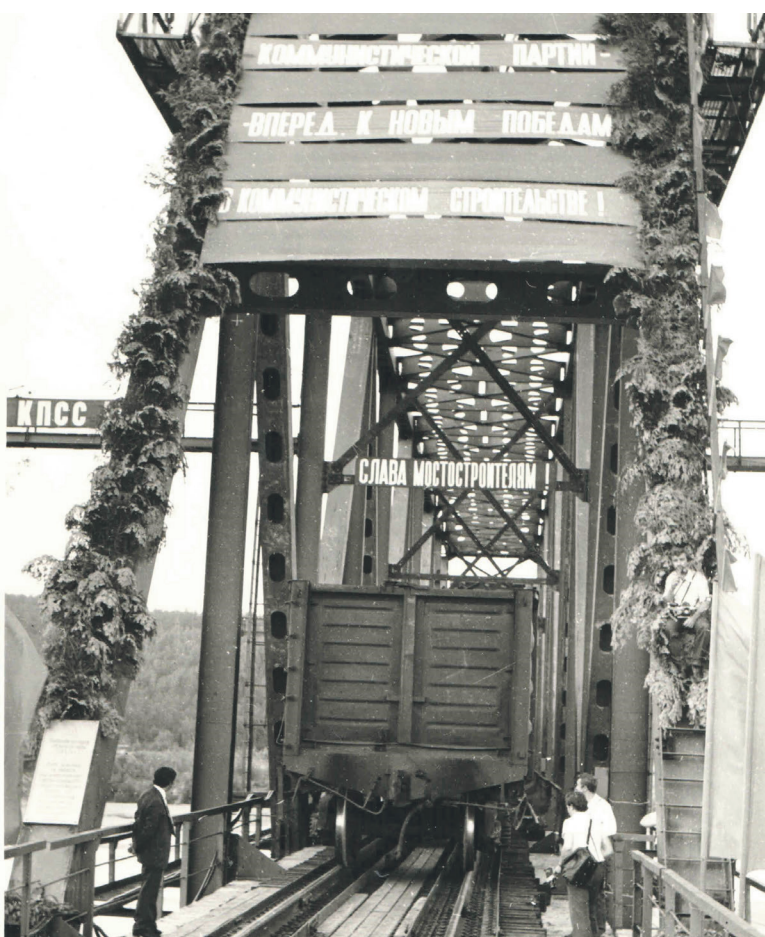
Капитальный мост через Бурею (1984 г.)