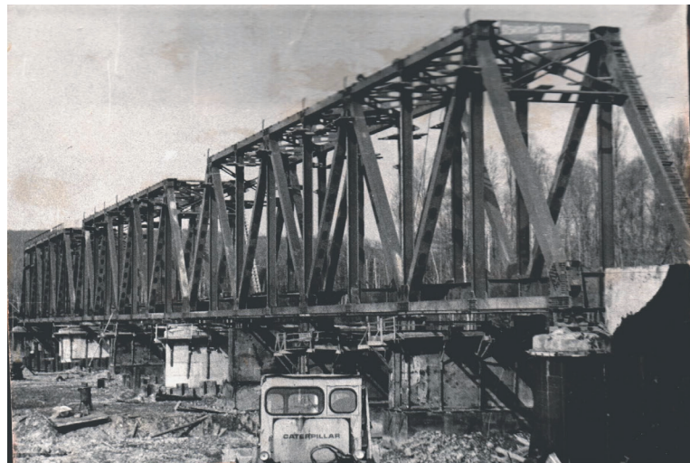
Мост через Аякит (1977 г.)

Начинался Амурский мост со строительства жилья, клуба, бани, котельной в посёлке, ко-