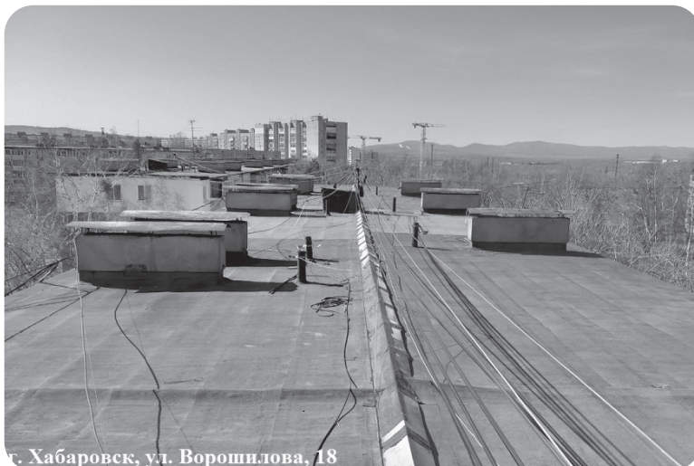
Хабаровск, ул. Ворошилова, 18

Так, за 2024 год в 90 многоквартирных домах было установлено 245 новых подъемников на 958 млн руб., отремонтировано 110 крыш на 729 млн руб. Следующий по популярности вид работ – капитальный ремонт фасада, их обновили у 49 дома на 304 млн руб. Активно собственники голосуют и за обновление внутридомовых инженерных систем горячего и холодного водоснабжения, водоотведе-