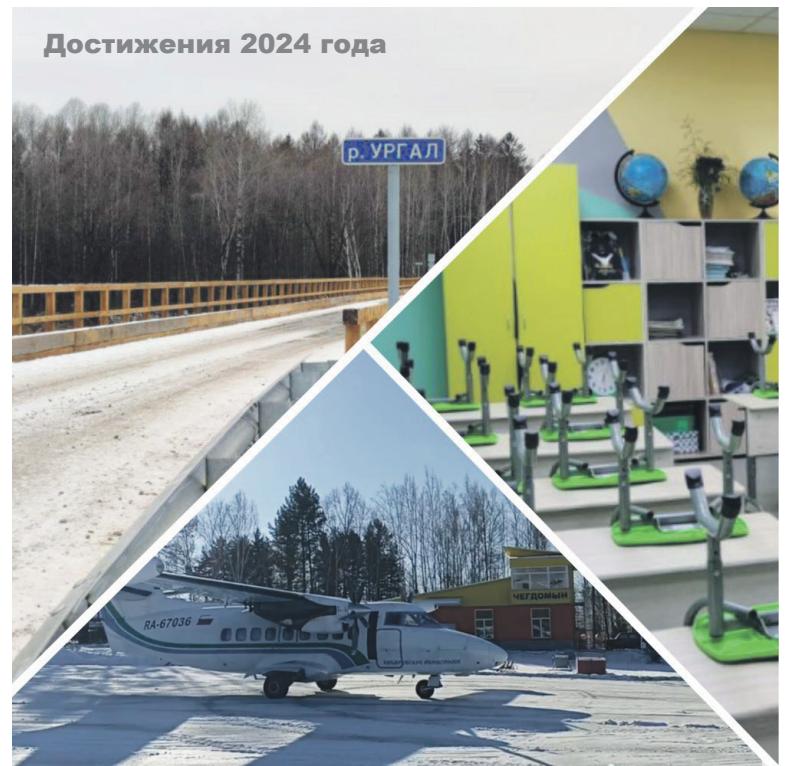
Достижения 2024 года Планы на следующий год амбициозны и грандиозны. Продолжается ремонт районного Дома культуры, строительство парка "Патриот", и в установленные сроки эти объекты откроют перед нами свои двери.

До конца января у главы района запланированы рабочие поездки в посёлки Софийск, Герби, информационные встречи в Солони и Сулуке.