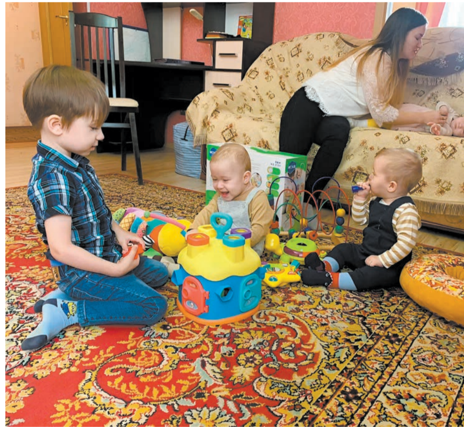
Многодетных семей в Хабаровском крае становится больше

Параллельно с этим необходимо работать над повышением социального статуса территории. Входит в него в том числе и качество среды, в ко-