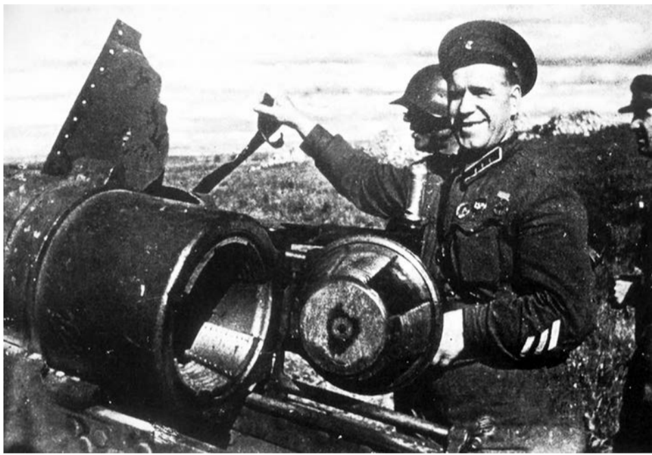
Комкор Жуков у захваченной японской гаубицы

В этом году отмечается 85-летие вооружённого конфликта на реке Халхин-Гол между войсками СССР и Японией. Историки считают эти события генеральной репетицией Второй мировой войны. Здесь свой талант полководца впервые продемонстрировал будущий маршал Советского Союза Георгий Жуков, а наши войска отработали многие тактические, стратегические и технические манёвры на земле и в воздухе.