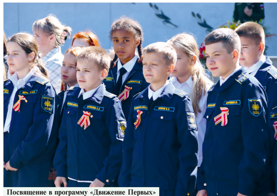
Посвящение в программу «Движение Первых»