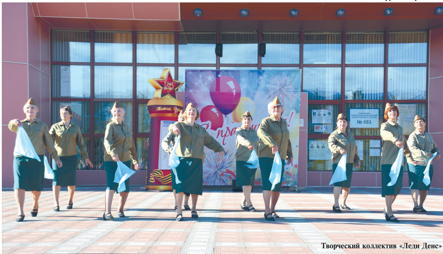
Творческий коллектив «Леди Денс»

колепным пением исполнителей, но и атмосферой подлинного театрального действия. Все эти проникновенные выступления тронули сердца собравшихся, напоминая о героизме и жертвах, принесённых на алтарь Победы.