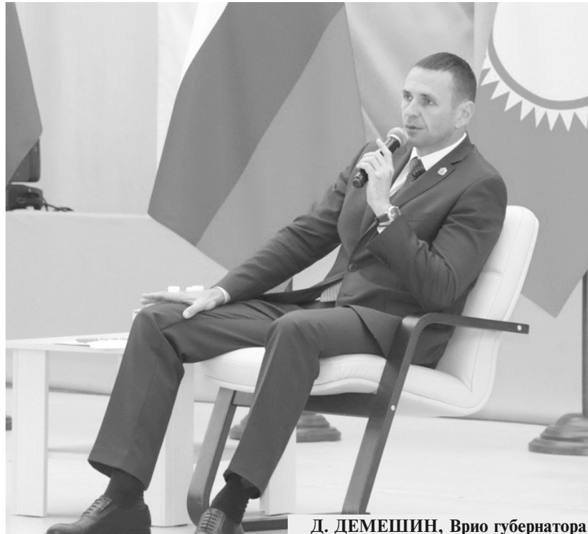
Д. ДЕМЕШИН, Врио губернатора