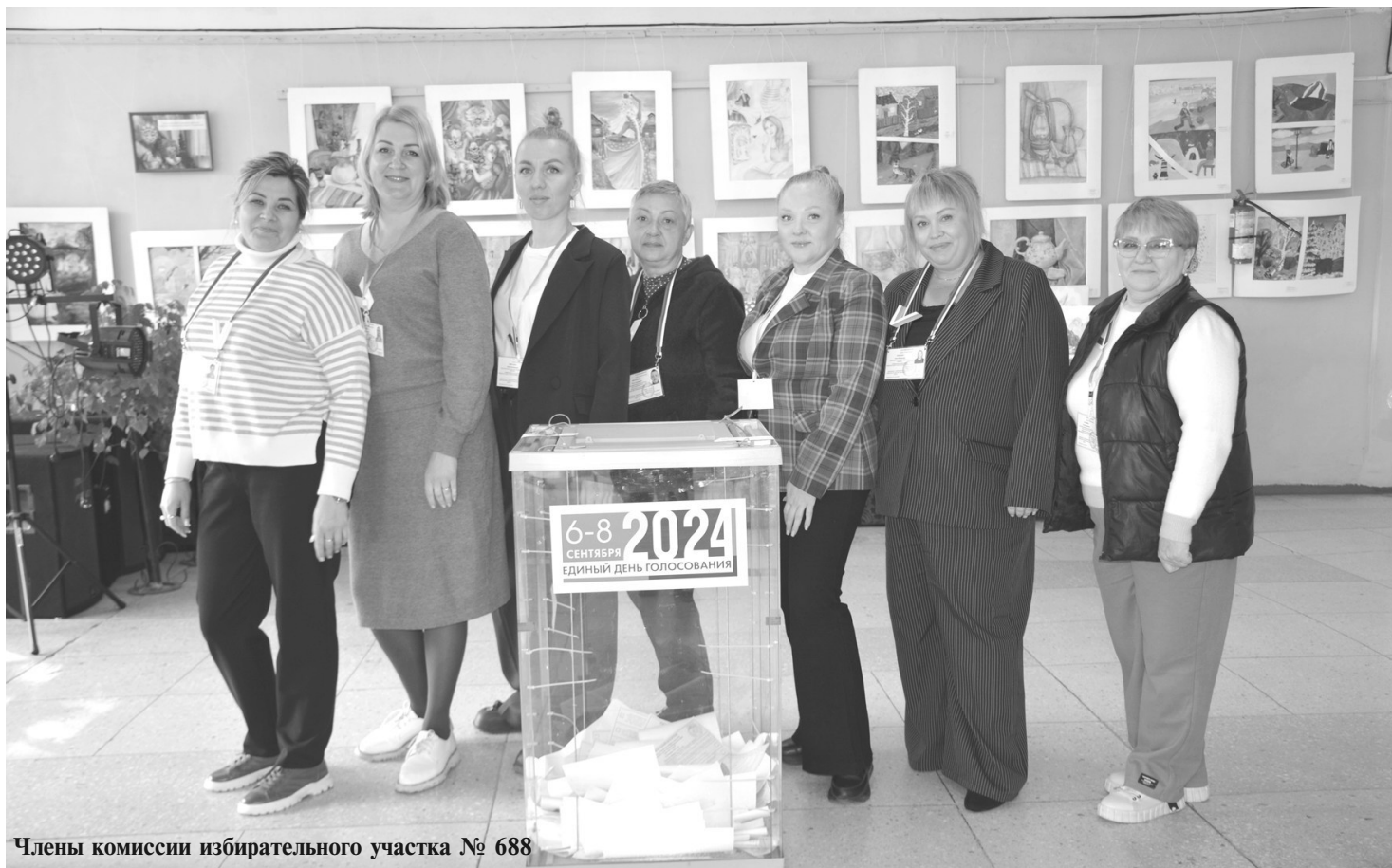
Члены комиссии избирательного участка № 688

Явка в целом по Солнечному району составила 30,51%.