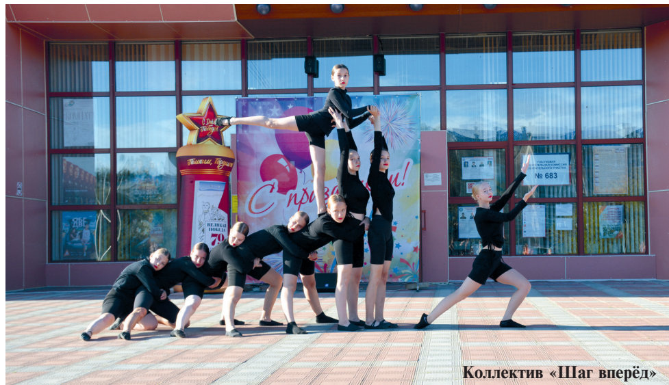
Коллектив «Шаг вперед»