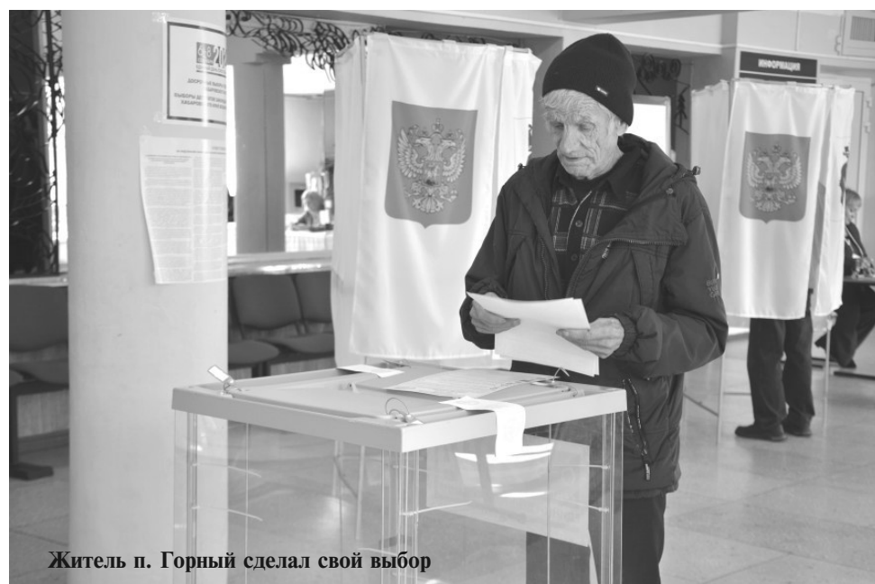
Житель п. Горный сделал свой выбор