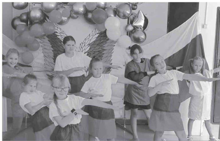
● Участницы флешмоба — танцевальная группа Уктура.

— В начале встречи в рамках Всероссийской акции «Российский триколор» активистами Дома культуры под