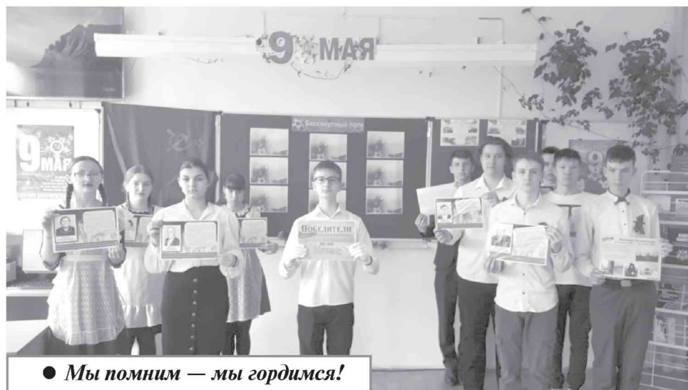
● Мы помним — мы гордимся!

Также юные патриоты — активные участники школьного научного общества «Истоки» и мероприятий, проводимых в Доме культуры: уро-