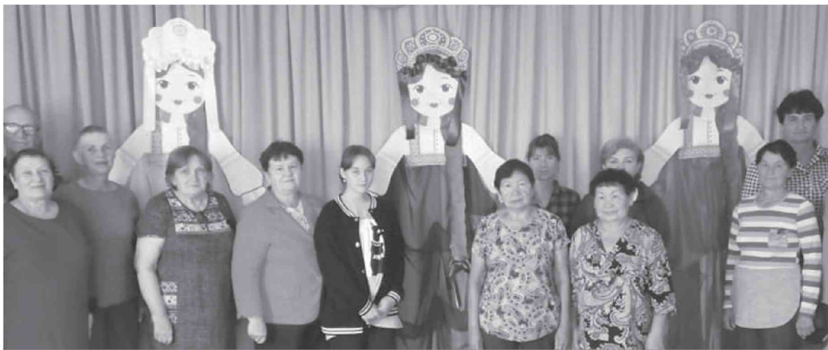
● Бокторцы ответственно отнеслись к проведению праздничного мероприятия.