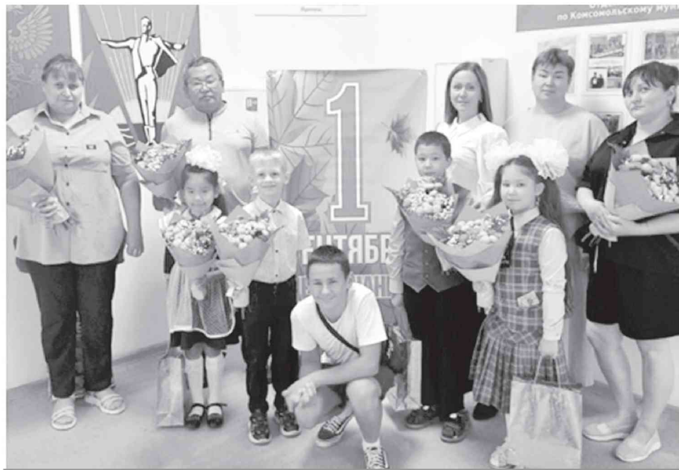
● Участники информационной встречи.