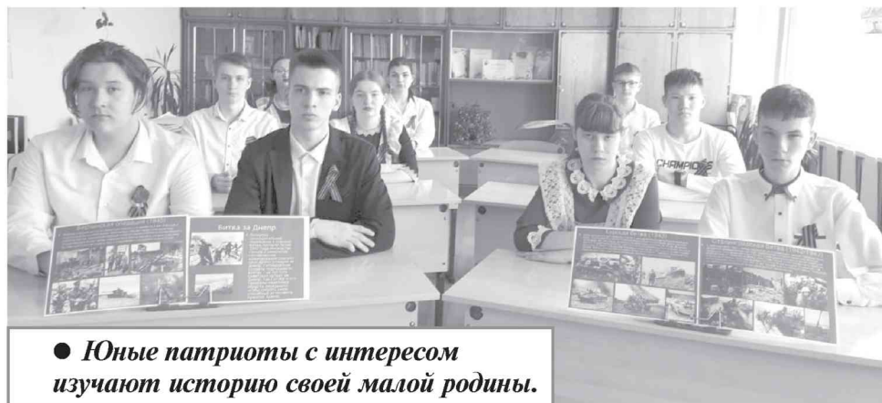
● Юные патриоты с интересом изучают историю своей малой родины.

Новыми сведениями пополняется и лента памяти «Помним каждого» в