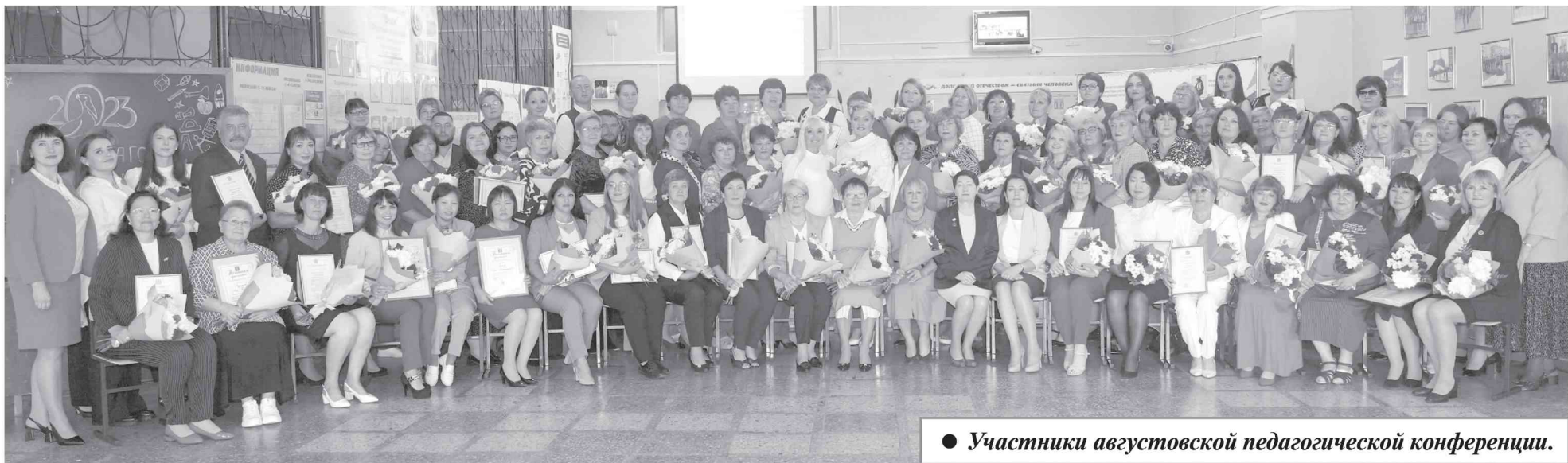
● Участники августовской педагогической конференции.

согретую душевным теплом педагогов, их энтузиазм и творчество, она говорила о важнейшей роли наставника в развитии и воспитании учащихся. Ведь даже самые современные технологии не могут заменить учителя со светлой душой и добрым сердцем, по-настоящему любящего детей и свое дело. Люди этой профессии, которые сегодня обеспечивают реализацию нововведений, качественное и доступное образование, передают ученикам главные жизненные ценности, способны изменить мир к лучшему, вырастив поколения креативной, думающей, успешной молодежи.