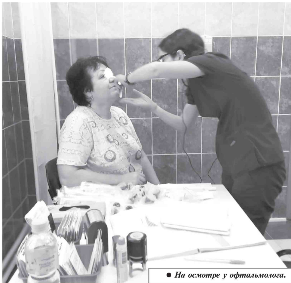
● На осмотре у офтальмолога.

Руководитель мобильной бригады врачей теплохода «Здоровье» На-