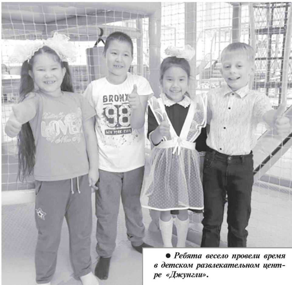
● Ребята весело провели время в детском развлекательном центре «Джунгли».

С. ЛУКИНА, и.о. начальника отдела опеки и попечительства по Комсомольскому муниципальному району.