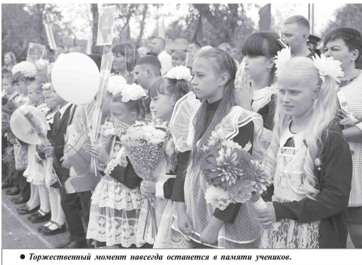
● Торжественный момент навсегда останется в памяти учеников.