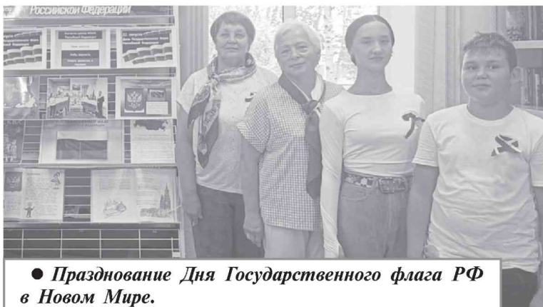
● Празднование Дня Государственного флага РФ в Новом Мире.

Также для детей прошел мастер-класс по изготовлению заколки-триколора и был организован флешмоб, в ходе которого участницы танцевальной группы ярко и эмоционально исполняли свой номер.