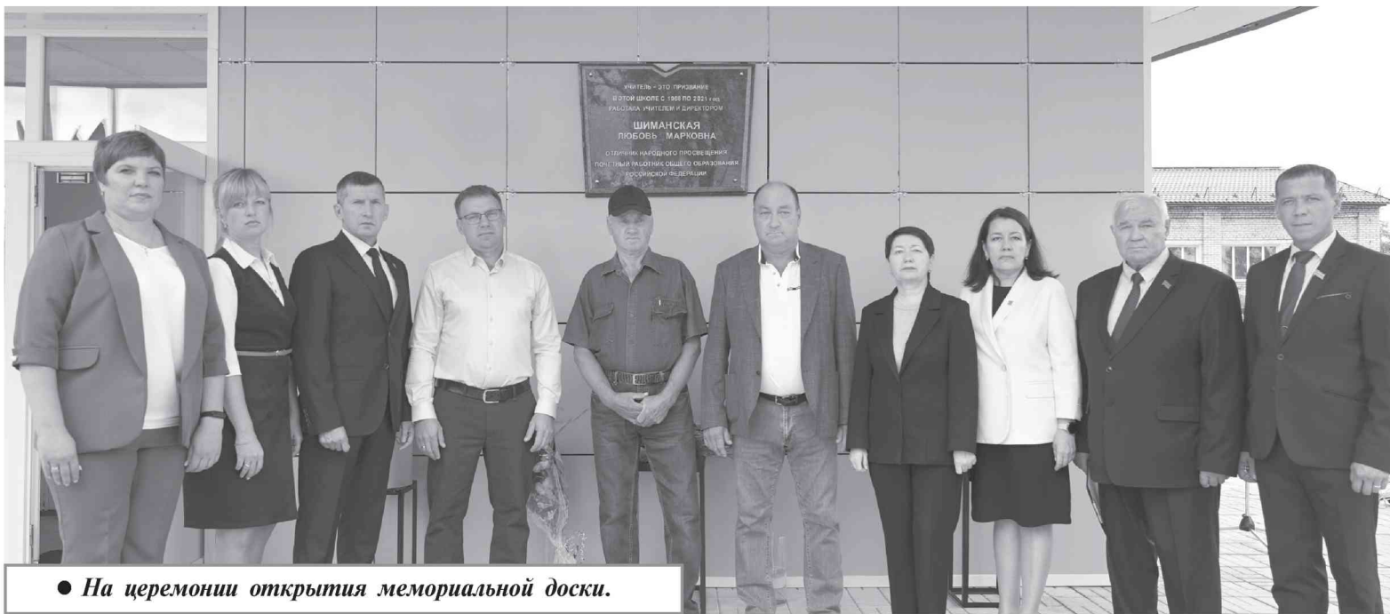
● На церемонии открытия мемориальной доски.