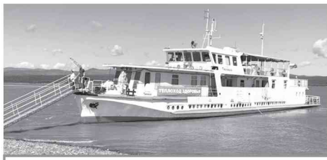
● Теплоход «Здоровье» причалил к очередному пункту назначения.

В период с 18 по 24 августа в сельских поселениях Комсомольского района Ягодный, Новоильинка, Черный Мыс, Нижнетамбовское, Нижние Халбы, Верхнетамбовское и Бельго работал теплоход «Здоровье».