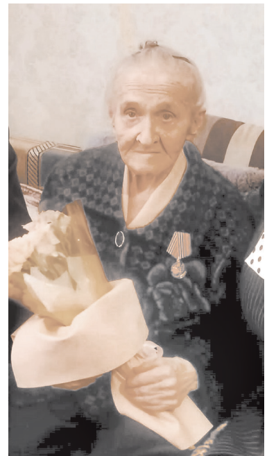
её военных годах, о подвигах и испытаниях, которые выпали на долю поколения победителей.