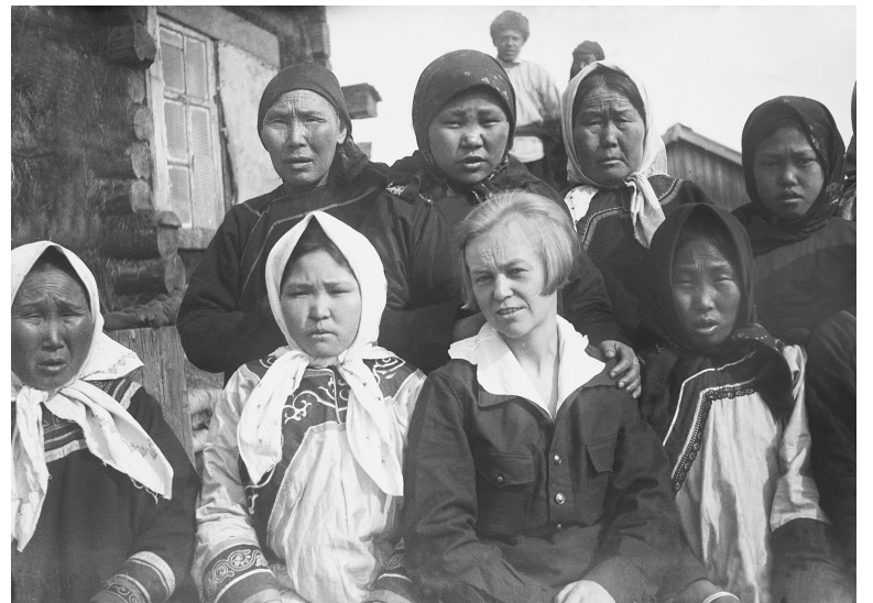
Делегатки ст. Пашня на праздновании 8 марта в Нижних Халбах, 1930 г.