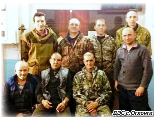
ДЭС с. Оглонги