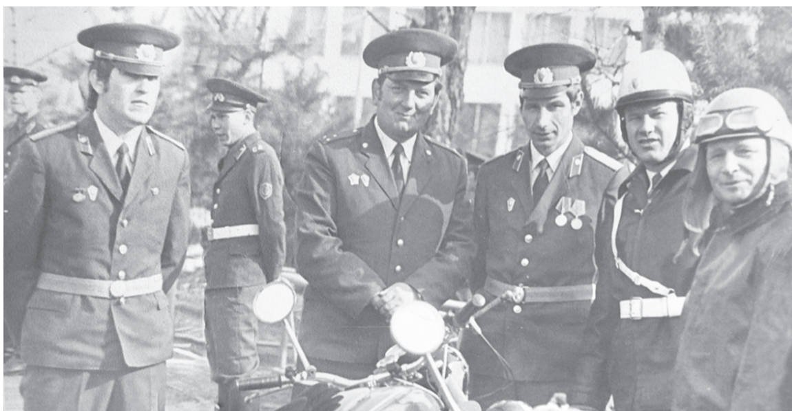
На охране общественного порядка на параде 9 мая