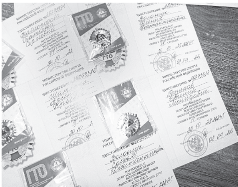
Восемь золотых значков ГТО отправились в Капитоновку

Подводя итог всему вышесказанному, можно справедливо заметить, что главный ресурс российского спорта – человеческая увлечённость. Когда учитель готов бежать «за компанию» с детьми, а ученики видят перед собой живой пример, значки ГТО превращаются из формальности в заслуженную долгожданную награду за труд.