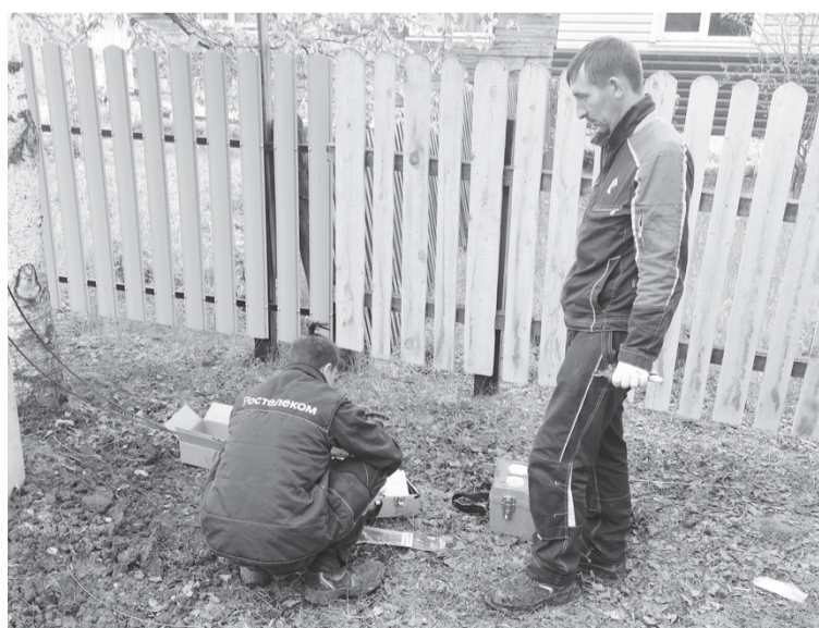
Специалисты ПАО «Ростелеком» монтируют опоры для высокоскоростного интернета в Капитоновке на улице Лесной

что интернет проводится в отдаленное село на условиях не только выигранного проекта, но и при софинансировании со стороны ПАО «Ростелеком». «По региональному партийному проекту Единой России «ТОС – в каждый двор» в текущем году в Вяземском районе 17 проектов инициативных граждан получат финансирование на их реализацию. В целом в Капитоновку благодаря работе ТОС в этом году привлечено уже около трех миллионов рублей, кроме проведения высокоскоростного интернета здесь будет построена игровая площадка для малышей и стоянка для велосипедов. Это успешный результат работы целой команды из жителей и администрации села, а также администрации района», –