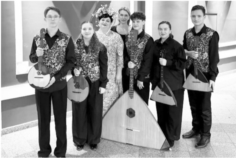
Ансамбль «Русский лад» вяземской школы искусств

Музыканты из Вяземского стали лауреатами международного конкурса во Владивостоке.