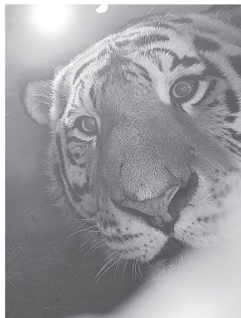
Этот красавец держал в страхе жителей Среднехорского.

Еще один конфликтный тигр регулярно появляется в Бичевой. Жители обеспокоены, ведь хищник представляет реальную угрозу для жизни не только животных, но и людей. В правительстве Хабаровского края отметили, что на месте работает мобильная группа, которая держит ситуацию на контроле.