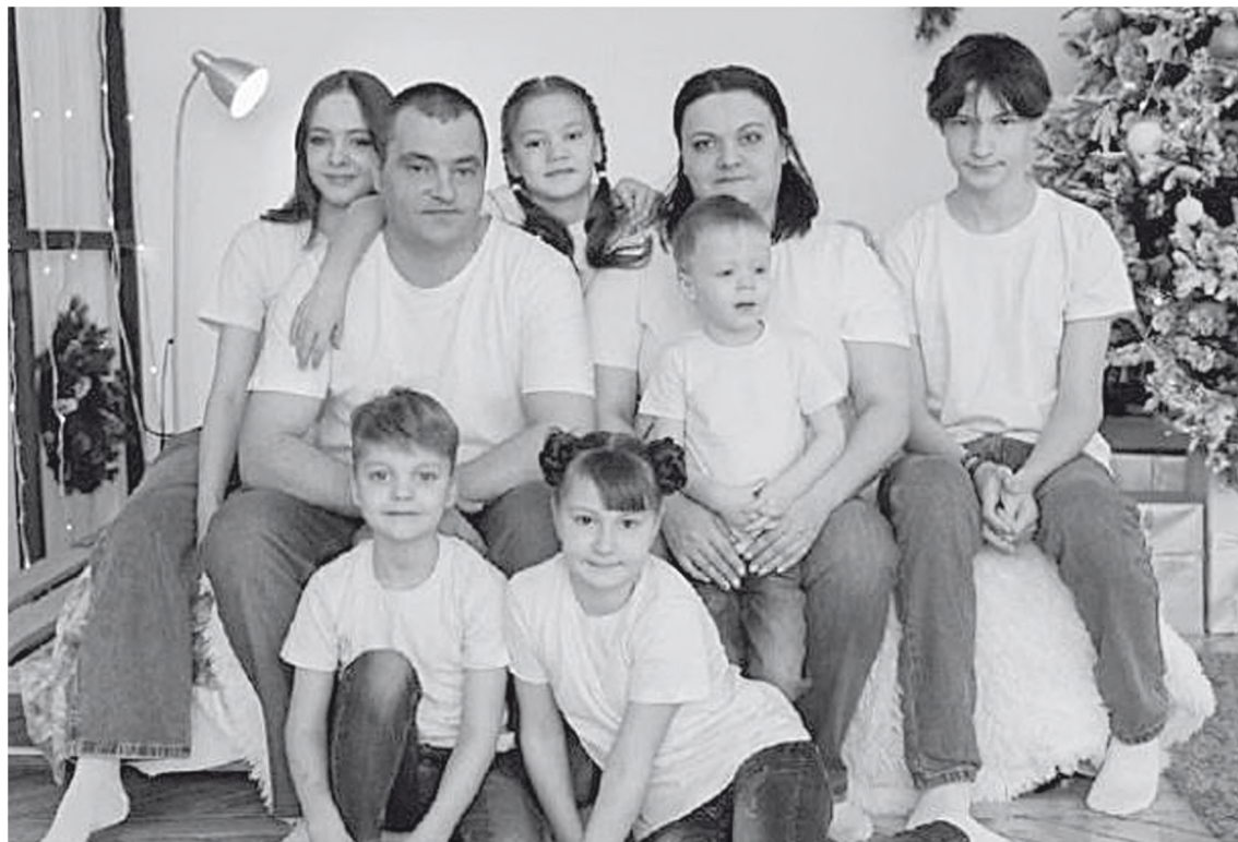
Ещё недавно их было восемь...