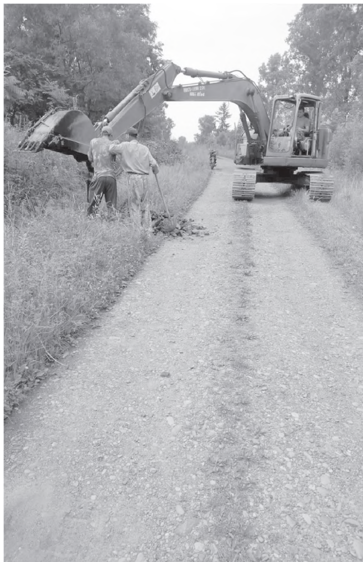
На первом этапе вдоль улиц были прорыты глубокие кюветы для стока воды.

Решить проблему затопляемости своих улиц взялся ТОС «Золотой ключ». Его проект по строительству водоотводной системы вошел в число победителей конкурса и получил финансовую поддержку из краевого бюджета.