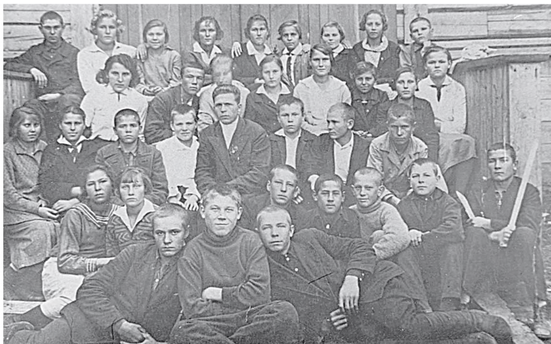
Уникальный предмет из архивного фонда – снимок первого выпуска Хорской восьмилетней школы 1935 г.

Одной из самых интересных форм комплектования архива является создание фонда личного происхождения, состоящего из уникальных документов, которые передаются на хранение из семейных архивов.