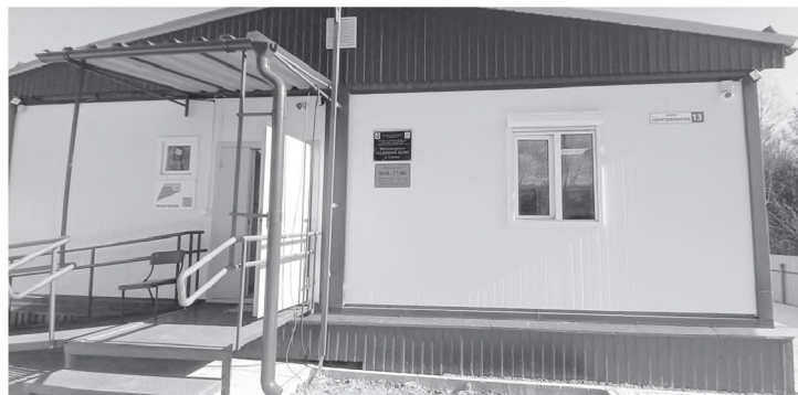
Новый ФАП в Сидиме.

реньком, тесном здании, где все удобства были на улице. Старалась там поддерживать порядок, вместе с помощницей по хозяйству белила и красила помещения, проводила в них дезинфекцию. Составила подробную карту текущих жителей села, чтобы точно знать, сколько детей и взрослых у нее на участке, у кого какие болячки и кто обязательно должен быть на постоянном медицинском контроле.