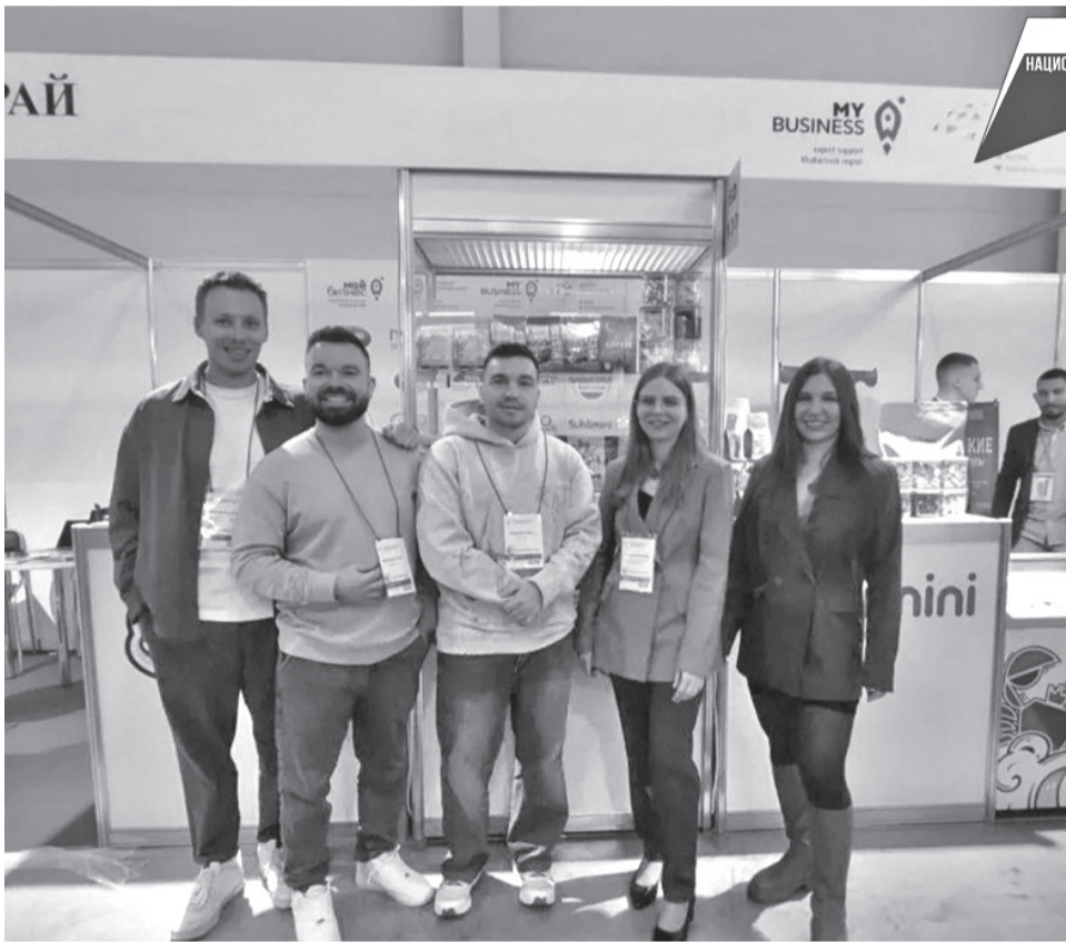
Фото выставки министерства экономического развития Хабаровского края

Предприятия края выступили на коллективном стенде при содействии краевого Центра поддержки экспорта в рамках нацпроекта «Международная кооперация и экспорт». Такая мера поддержки для малого и среднего бизнеса положительно сказывается на развитии деловой активности, улучшает инвестиционный климат в регионе, открывая местные рынки для товаропроизводителей.