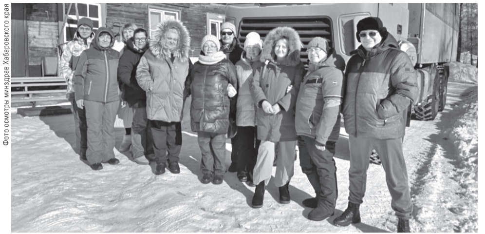
Фото осмотра минздрава Хабаровского края

Напомним, стать участниками международных выставок, а также других мероприятий, направленных на продвижение продукции за рубеж, могут малые и средние компании края. Для получения поддержки нужно обратиться в краевой Центр экспорта по телефонам: +7 (4212) 35-84-45, 77-01-22, а также по адресу: г. Хабаровск, ул. Истомина, 51А, каб. 705.