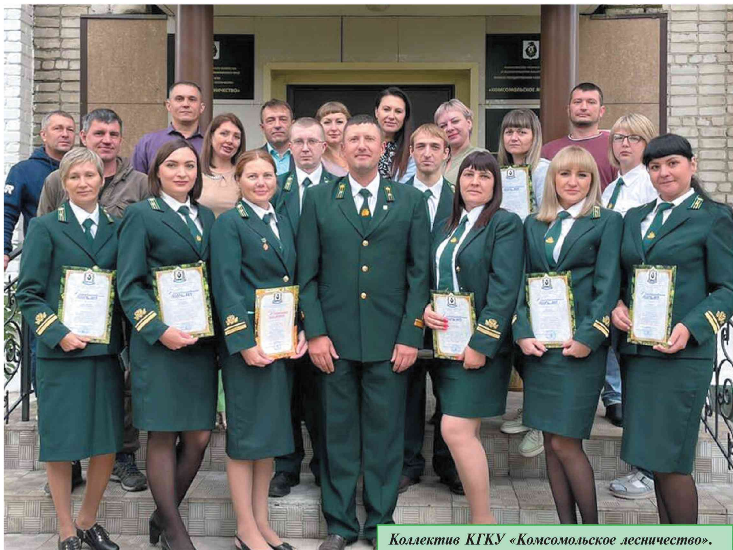
Коллектив КГКУ «Комсомольское лесничество».