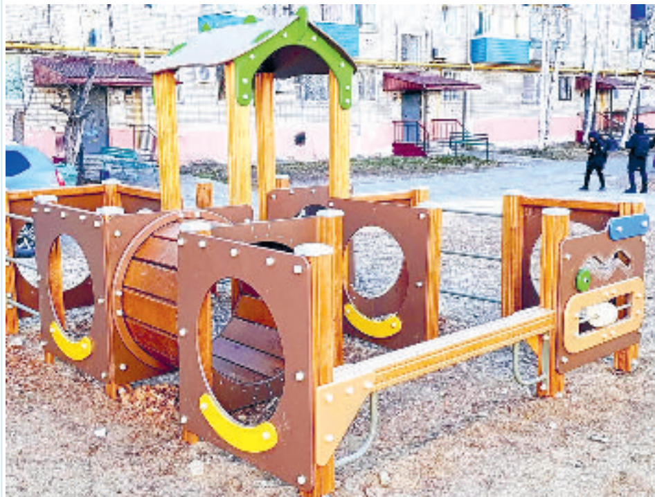
Материалы и фото с Телеграмм-канала главы Солнечного округа С. СЕМЁНОВА

На эти средства будут проведены работы по устройству уличного освещения и пешеходных дорожек, установке детских и спортивных площадок, благоустройству дворов, обустройству парковок и зелёных зон, устройству интернета.