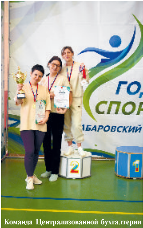
Команда Централизованной бухгалтерии