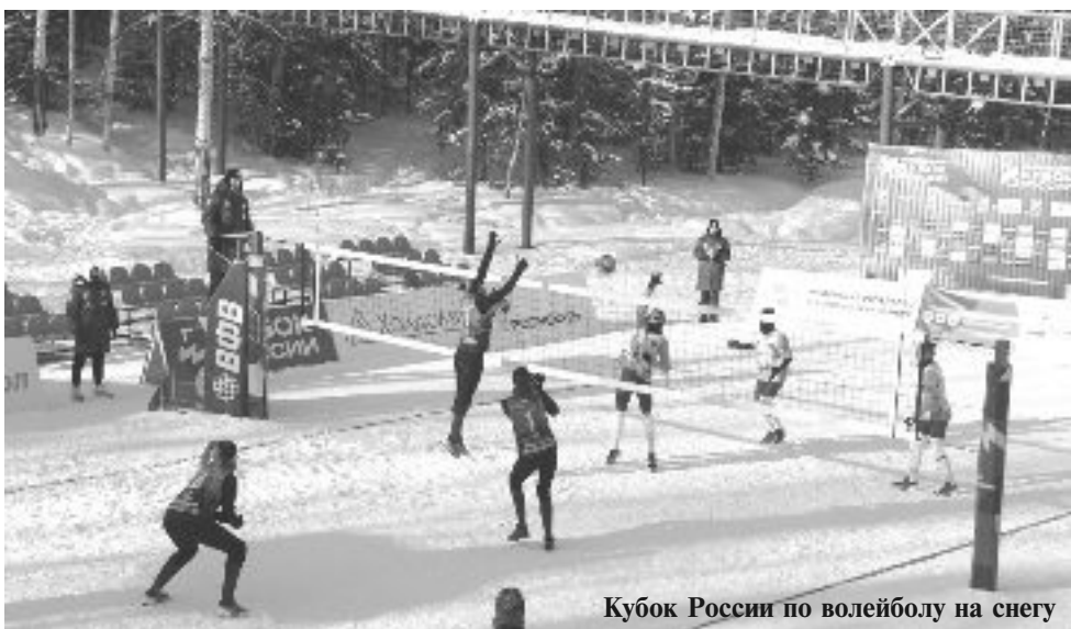
Кубок России по волейболу на снегу