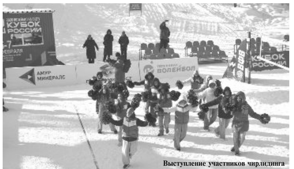
Выступление участников чирлидинга