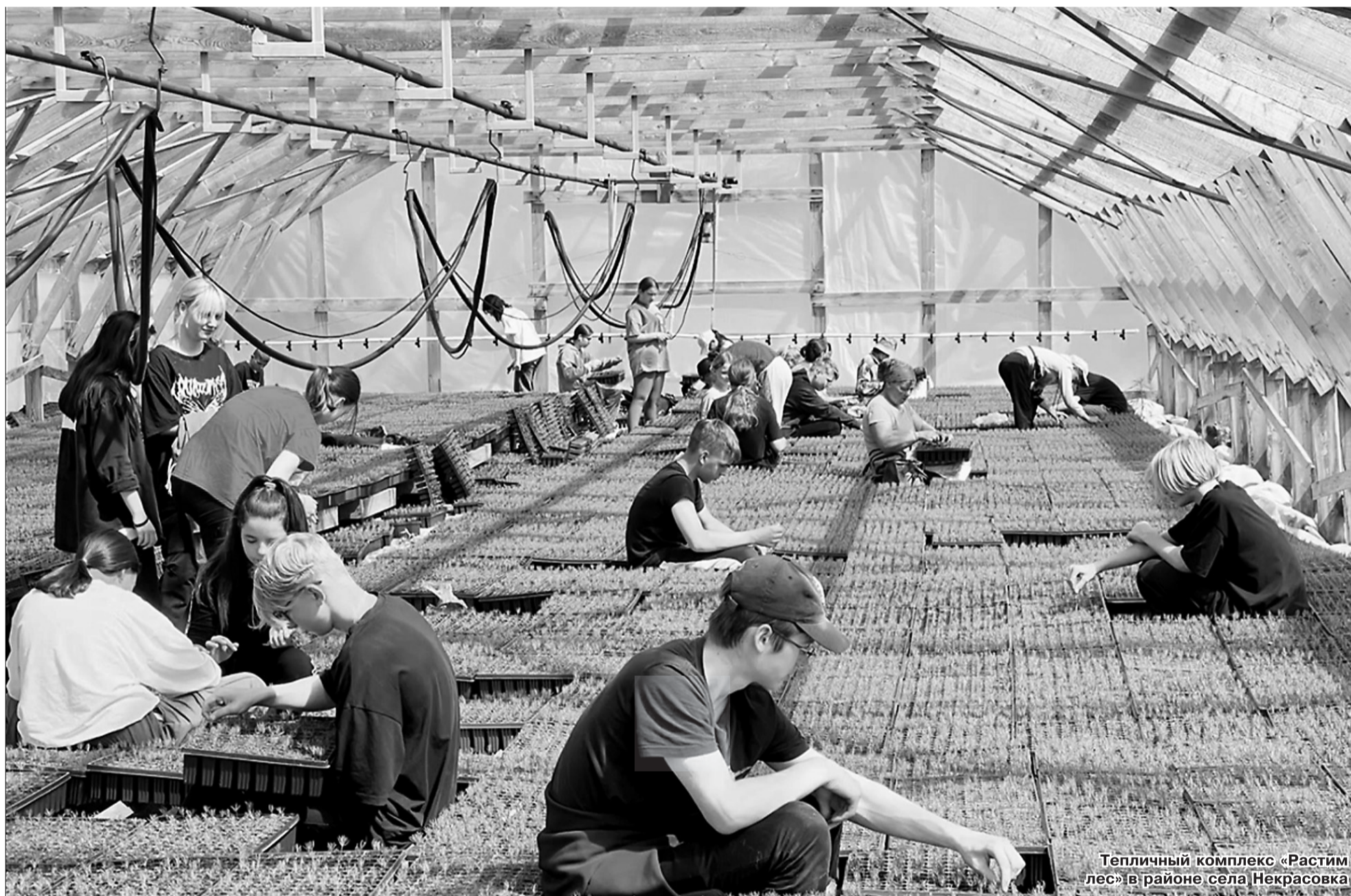
Тепличный комплекс «Растим лес» в районе села Некрасовка

Кластерную модель подготовки кадров для предприятий сельскохозяйственной отрасли обсудили сегодня на заседании рабочей группы в министерстве образования и науки Хабаровского края.