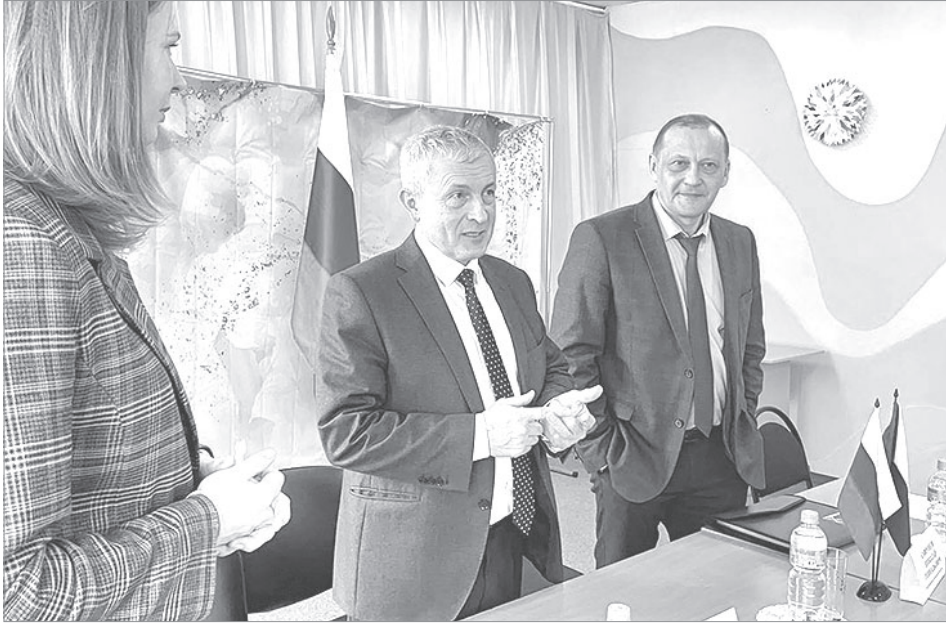
Педагог года – 2025

ния являются благоустройство улиц, дорог, работа по предупреждению и ликвидации последствий чрезвычайных ситуаций, обеспечение первичных мер пожарной безопасности, развития местного самоуправления, реализации муниципальных программ, действующих на территории сельского поселения, с учетом их приоритетности,