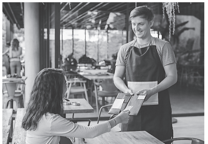
заведения до момента расчёта, действует с 1 марта 2025 года. Соответствующая поправка внесена в законодательство о приме-

Напомним, что правило, в соответствии с которым при оказании услуг в сфере общественного питания чек выдаётся посетителю