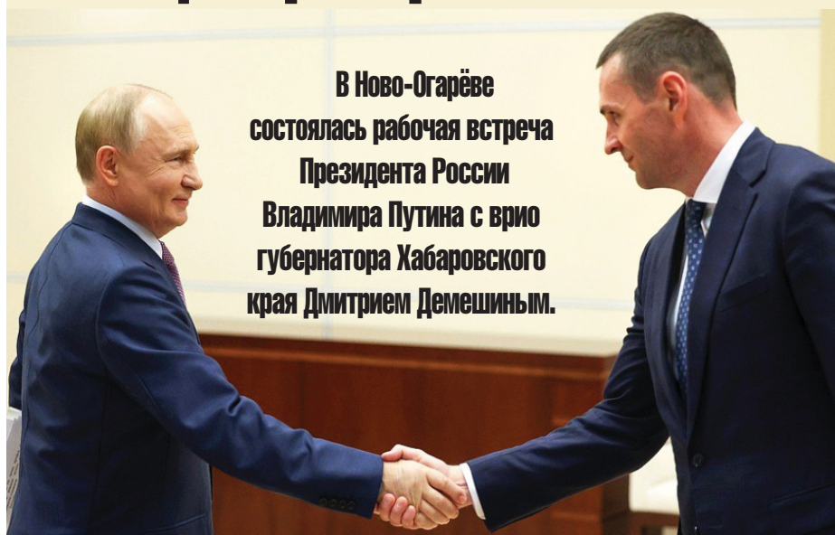
В Ново-Огарёве состоялась рабочая встреча Президента России Владимира Путина с врио губернатора Хабаровского края Дмитрием Демешиным.

В первую очередь глава государства поинтересовался, как работаете Дмитрий Демешину в новой должности.