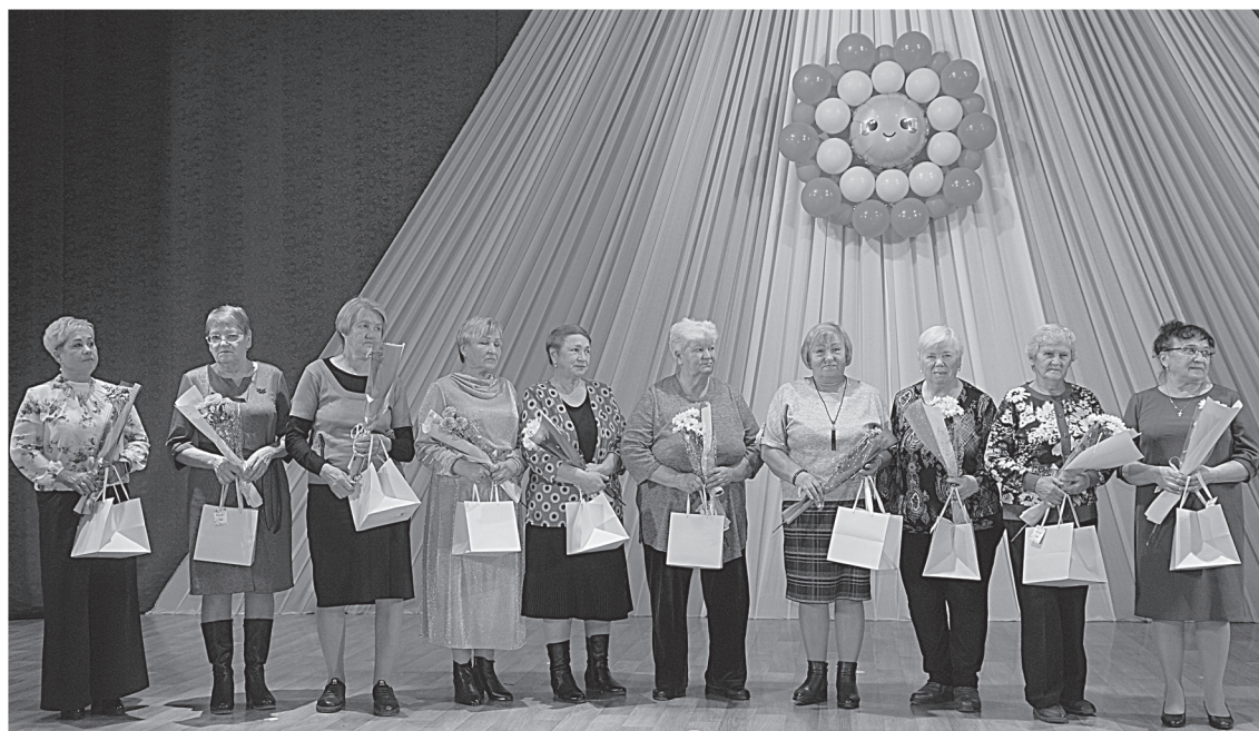
Всегда вы молоды душой!