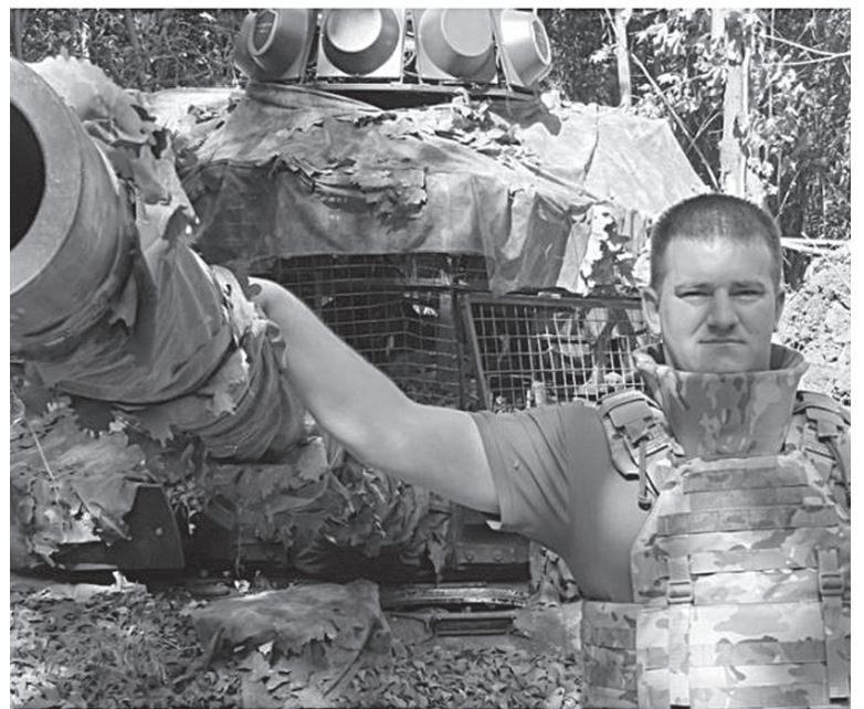
Сегодня он – командир батальона

поселок Торское – там две группы спецназовцев отражали наступление противника. Это была последняя брешь в кольце окружения. По прибытии в поселок обговорили тактику боя с командиром группы спецназа. Нам для поддержки этих бойцов нужно было уничтожить тяжелую технику ВСУ – два танка и две БМП (боевых машин пехоты). Их связной должен был нас вывести на лучшую позицию, но он в назначенный район не вышел, и мы двинулись наугад. Проехали три километра и оказались на стороне противника. И сразу два прилета вражеских снарядов. В общем, меня тут зацепило... Но мы все равно двинулись вперед. Нашли удачный маршрут, где с одной стороны болото, – значит, никто не обойдет с фланга, тут удача нам сопутствовала. Прокатились метров 200, смотрю в прицел, а на прямой наводке прямо передо мной стоит танк вражеский. Мы, скорее всего, были у него в слепой зоне – они нас не видели, а мы тут же среагировали. У нас был загружен снаряд кумулятивный (для поражения бронированных целей), первым же выстрелом украинский танк уничтожили, сгорел. Прошли немного вперед и повернули обратно – уточнить обстановку. Следовавшую за нами вторую машину я оставил на полпути – на случай, если вражеская техника начнет приближаться. Решение было верным – оно стоило ВСУ нескольких БМП. Обговорив с командиром группы дальнейшие действия, собирался