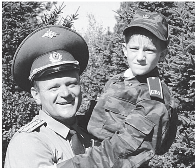
Суворовец из Переяславского детдома – любимец преподавателей и начальника училища