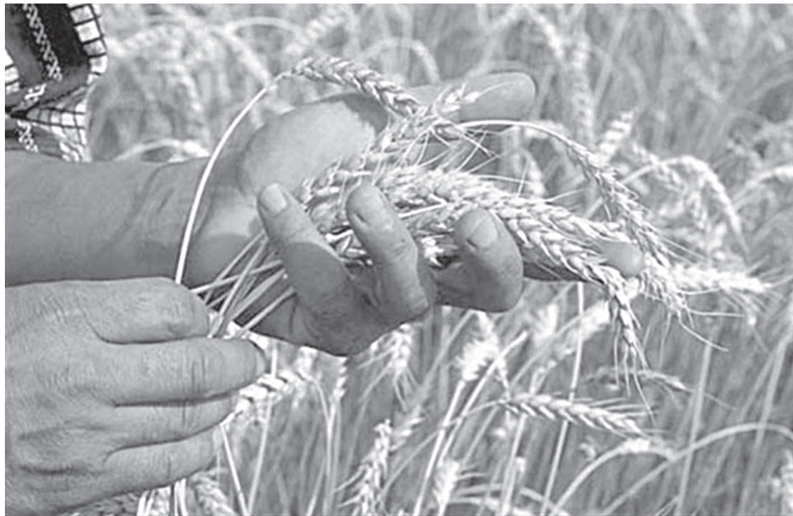
Площадь земель сельхозназначения в районе составляет сегодня более 116 тыс. гектаров