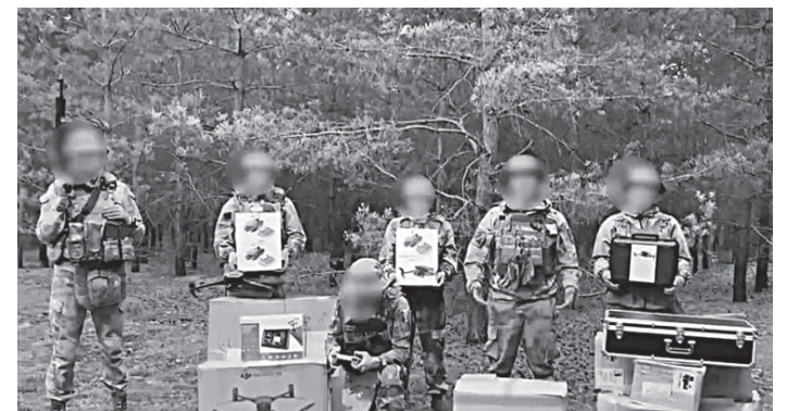
Эти важные технические средства для выполнения боевых задач передал для отправки в зону СВО губернатор края.

Новый порядок вывоза мусора из частного сектора разъяснили в министерстве ЖКХ края. Изменения касаются вывоза мусора так называемым бестарным методом – в пакетах. Новым порядком запрещается складировать ТКО и крупногабаритные отходы, то есть и пакеты с мусором, на земле за пределами контейнерных и специальных площадок.