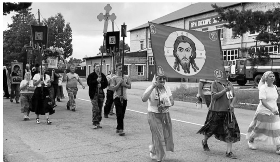
Крестный ход 2023 г.

отслужена Божественная Литургия. Трёхдневный Крестный ход завершится 21 июля Благодарственным молебном в храме Св. Николая.