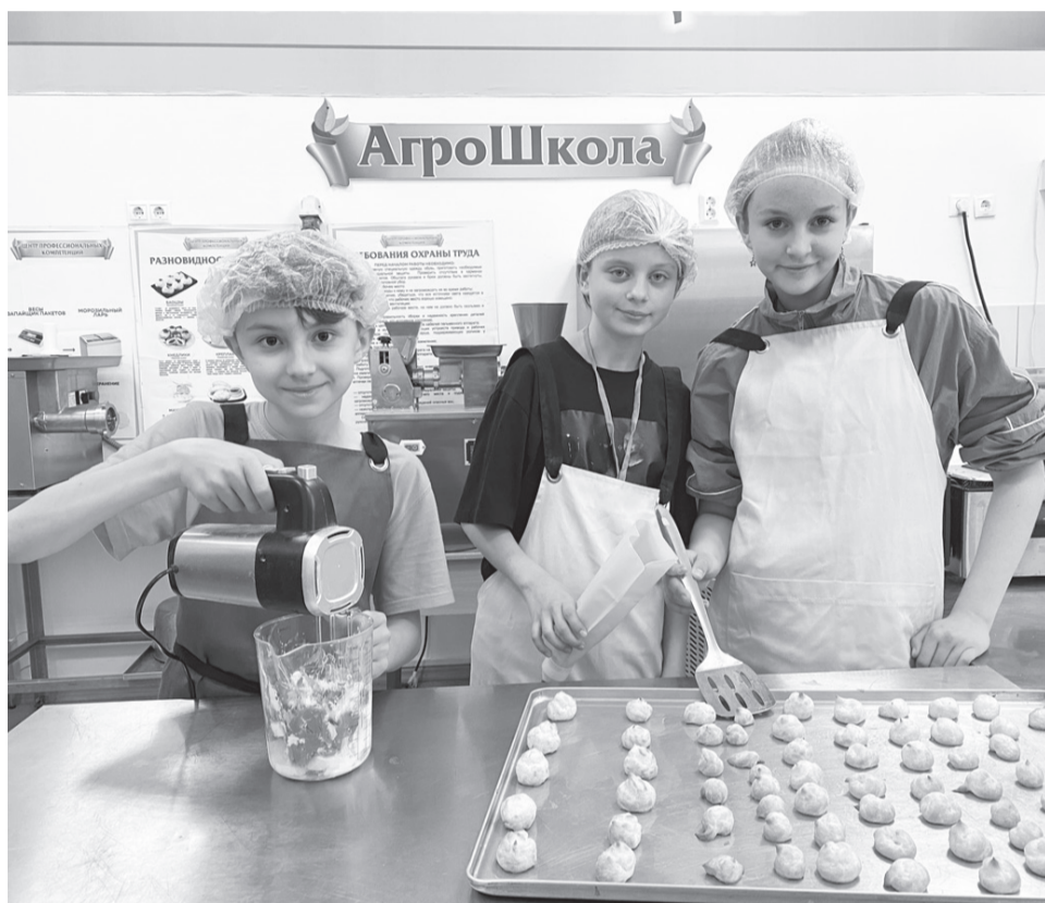
В загородном лагере «Лотос» ребята учатся готовить разные блюда

В загородном оздоровительном лагере «Лотос» на базе Агрошколы проходит смена «Большое путешествие», где школьники края будут отдыхать и получать новые знания.