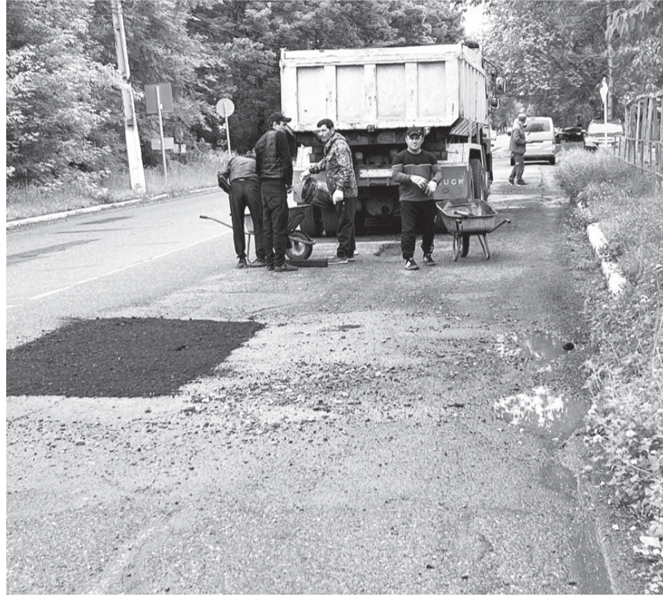
В дождь, в лужи кладут асфальт на центральной улице

Контракт на выполнение работ по текущему содержанию муниципальных дорог с асфальтобетонным покрытием на территории городского поселения «Город Вяземский» был заключен с индивидуальным