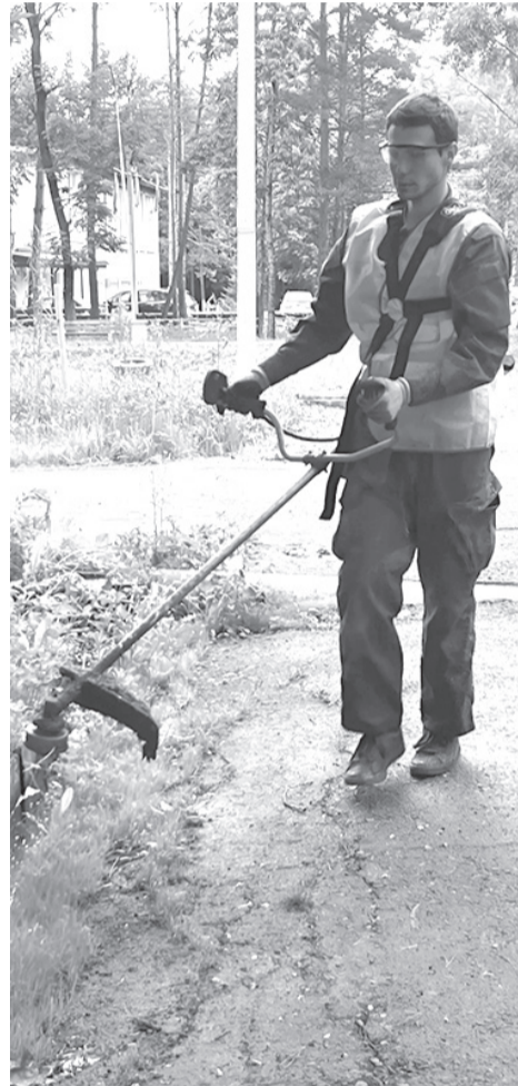
В Вяземском приступили к покосу травы

Выполнением работ по содержанию городского парка городского