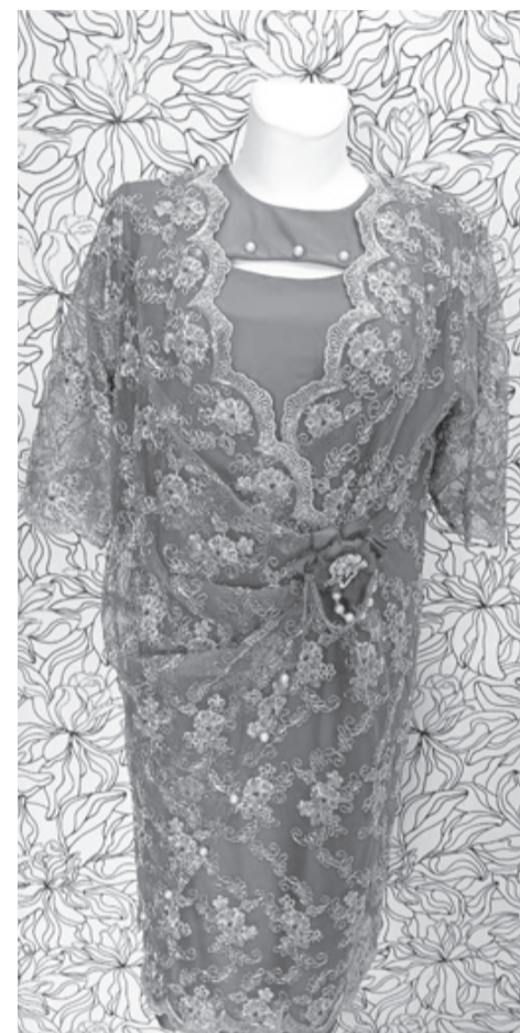
Изящное кружево для торжества

Деньги государственной поддержки направила на приобретение стола для раскроя, на манекены, необходимые инструменты, ткани. Самым дорогостоящим приобретением стала профессиональная швейная машина для трикотажа. Сейчас большой спрос на пошив три-