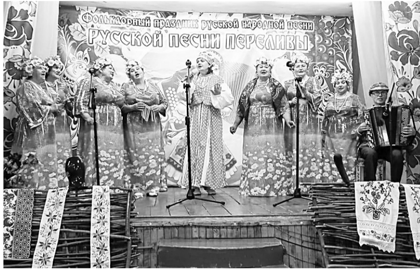
Народный хор «Лейся песня!» РДК «Радуга»

Праздник «Русской песни переливы» второй год проводит филиал Дома культуры с. Забайкальское. В нём приняли участие истинные ценители русской песни.