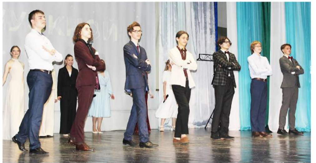
Выступление родительского актива средней школы № 16 имени Героя России Заволянского В.И. никого не оставило равнодушным