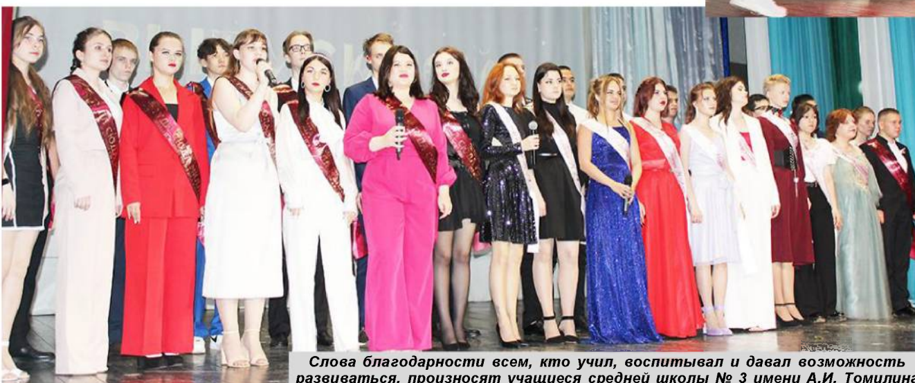
Слова благодарности всем, кто учил, воспитывал и давал возможность развиваться, произносят учащиеся средней школы № 3 имени А.И. Томилина

Трогательный до слёз праздник прощания со школой закончился по традиции встречей рассвета. В добрый путь, молодые совгаванцы! И пусть на этом пути у вас будет как можно меньше препятствий к достижению намеченных целей.