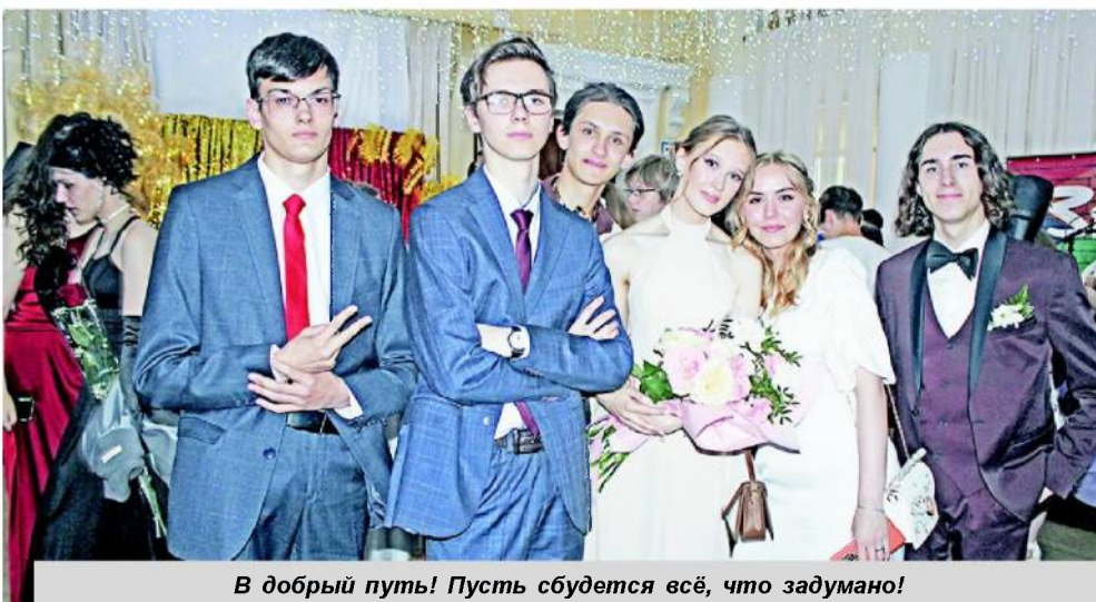
В добрый путь! Пусть сбудется всё, что задумано!

"Плечом к плечу" - так называлась ещё одна номинация. В ней отмечали благо-