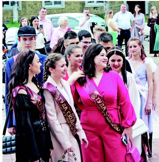
На "красной дорожке" - выпускники средней школы № 3 имени А.И. Томилина