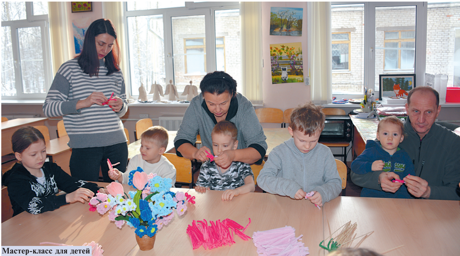
Мастер-класс для детей