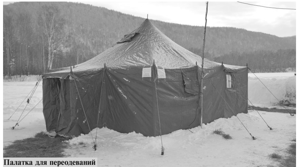
Палатка для переодеваний