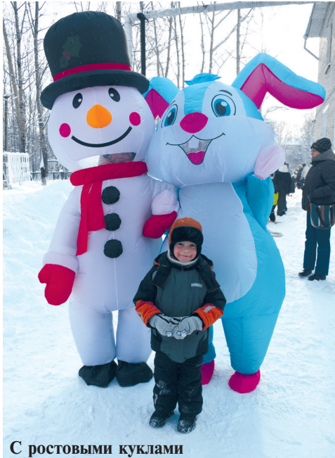
С ростовыми куклами