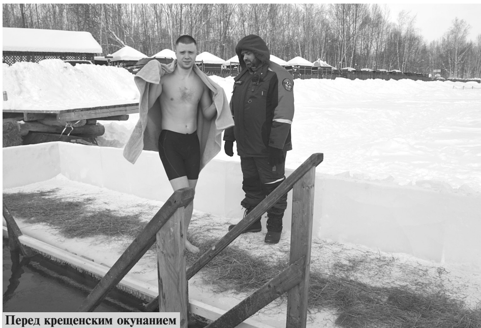
Перед крещенским окунанием