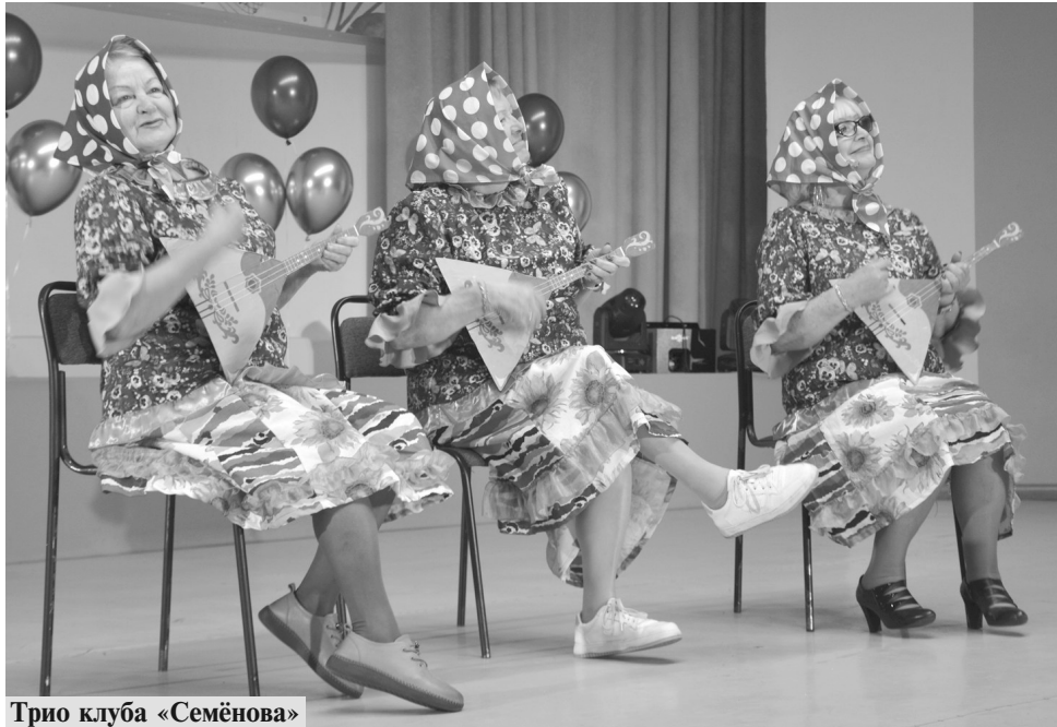
Трио клуба «Семёновна»

Все артисты получили искренние поздравления и аплодисменты. Концерт стал не только данью уважения мудрым людям, но и непередаваемым моментом объединения всех присутствующих.