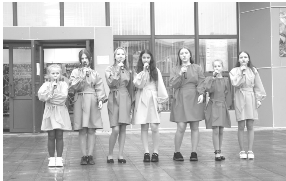
Коллектив «Планета Kids»