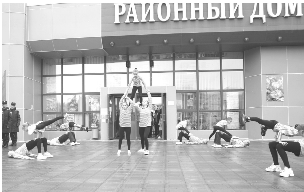
Творческое выступление акробатов