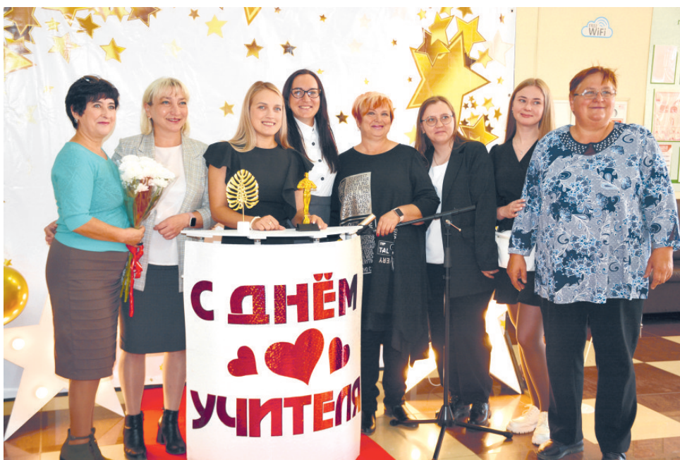
Коллектив Станции юных натуралистов посёлка Солнечный