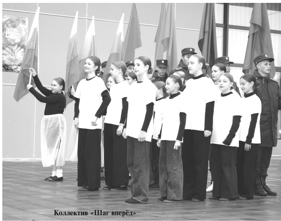
Коллектив «Шаг вперёд»

Президент Российской Федерации Владимир Путин назвал 30 сентября особым, торжественным и историческим днём – днём правды и справедливости. И в эту знаменательную дату на