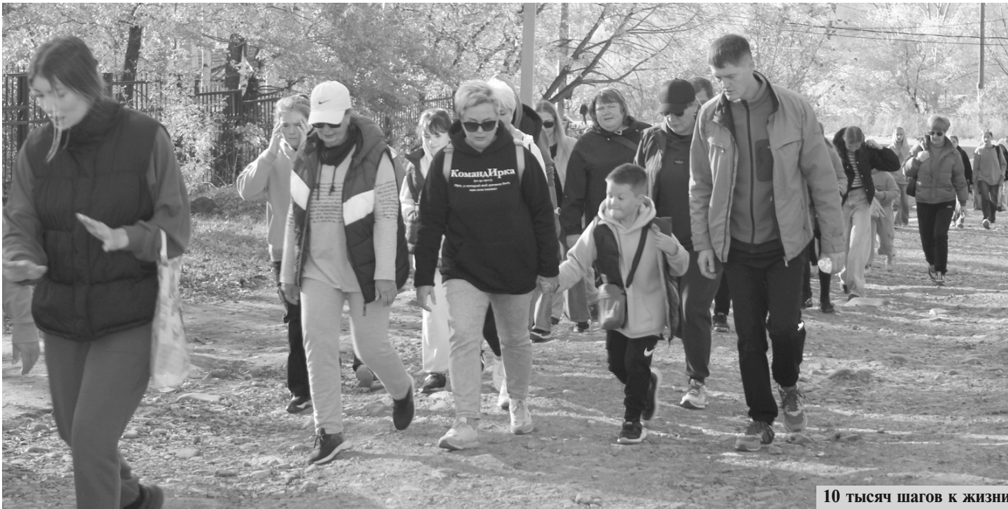
10 тысяч шагов к жизни