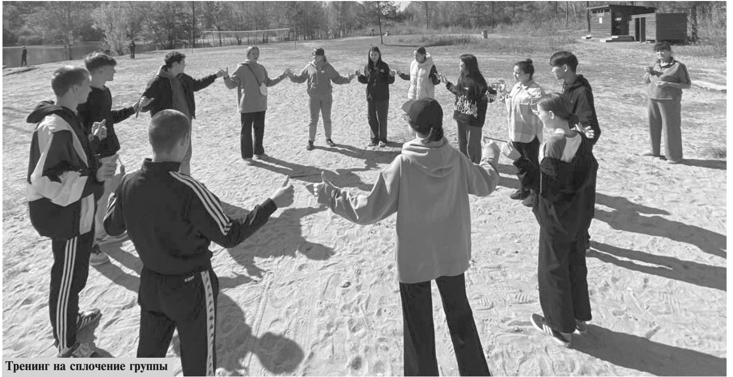
Тренинг на сплочение группы

Г. ТЕПЛЯКОВА, мастер производственного обучения Солнечного промышленного техникума