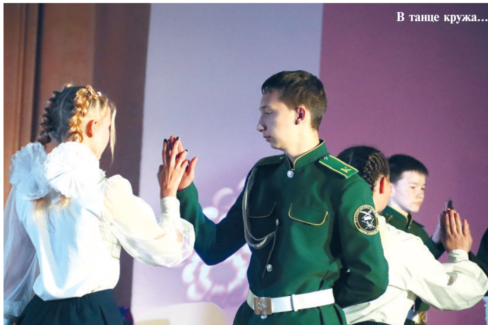
В танце кружа...