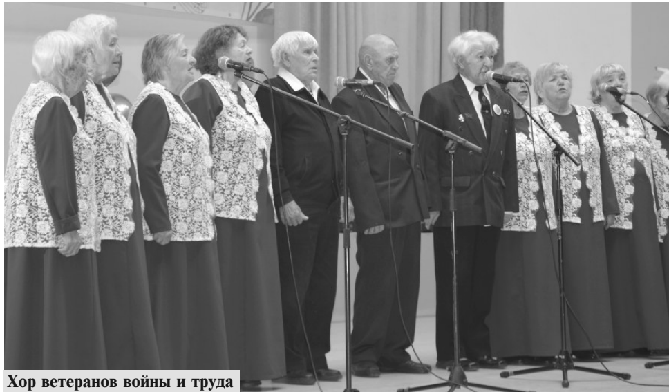
Хор ветеранов войны и труда