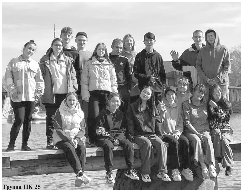
Группа ПК 25