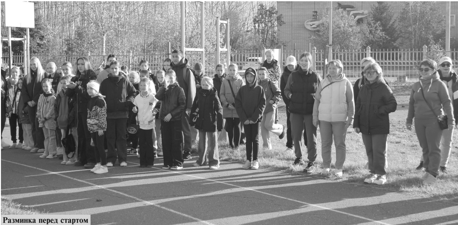
Разминка перед стартом

Ходьба - это естественный и безопасный способ укрепить сердечно-сосудистую систему, снизить уровень стресса и поддерживать физическую форму. В условиях современной жизни