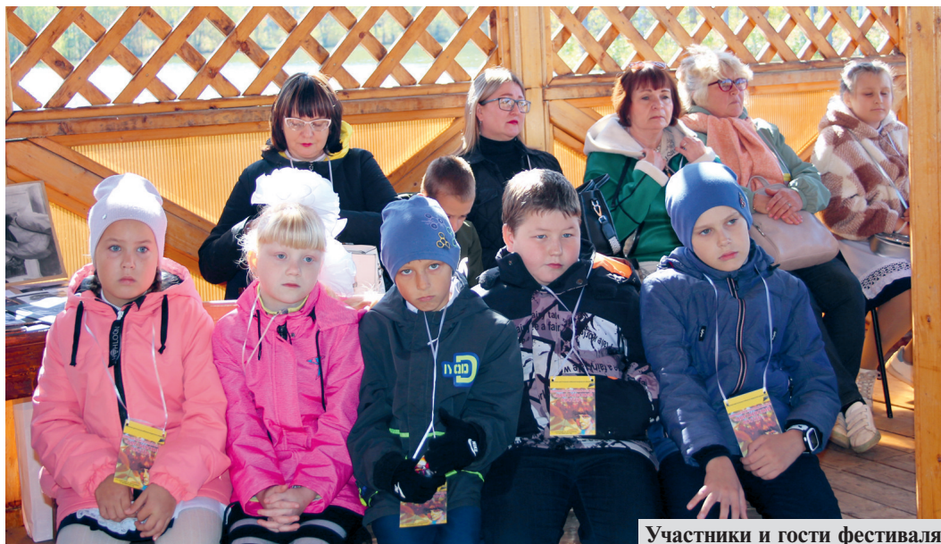
Участники и гости фестиваля