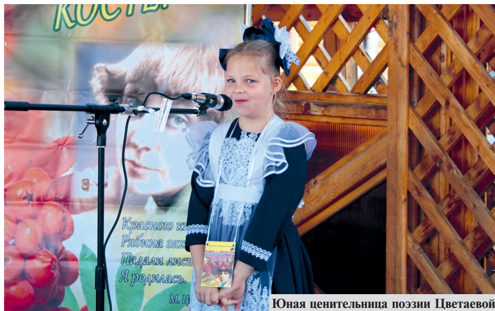
Юная ценительница поэзии Цветаевой