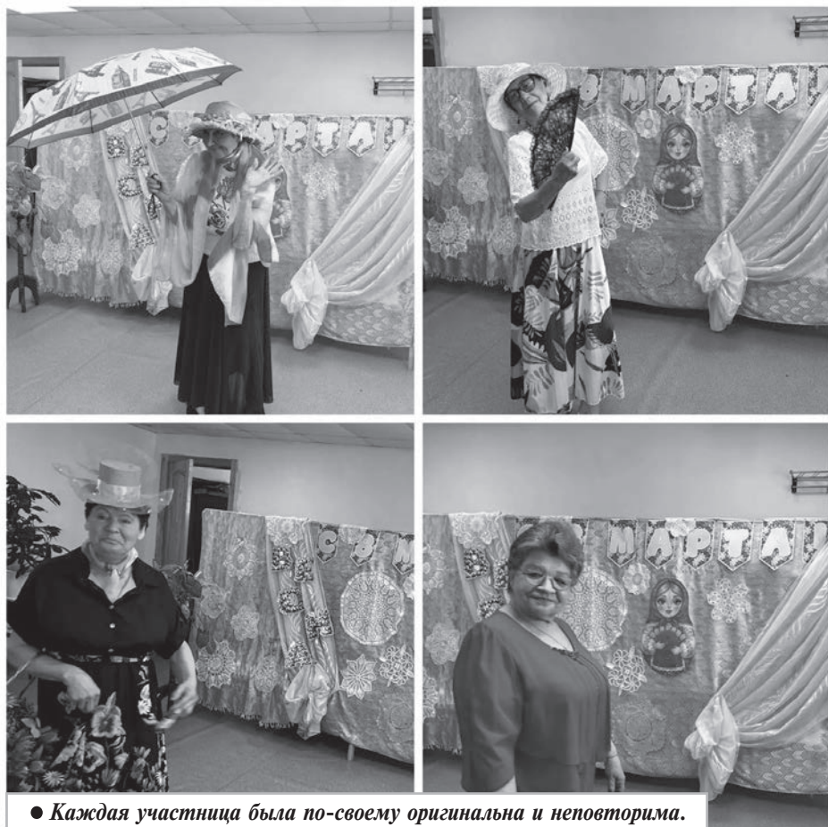
● Каждая участница была по-своему оригинальна и неповторима.

Кульминацией вечера стала беспроигрышная лотерея, в которой участвовали все без исключения, завершилось торжество традиционным чаепитием. Столы ломились от домашней выпечки и кулинарных изысков, которые ветераны приготовили с любовью к