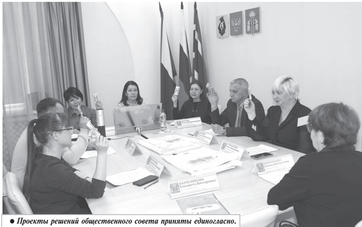
● Проекты решений общественного совета приняты единогласно.

Подготовила Т. ФУРЦОВА.