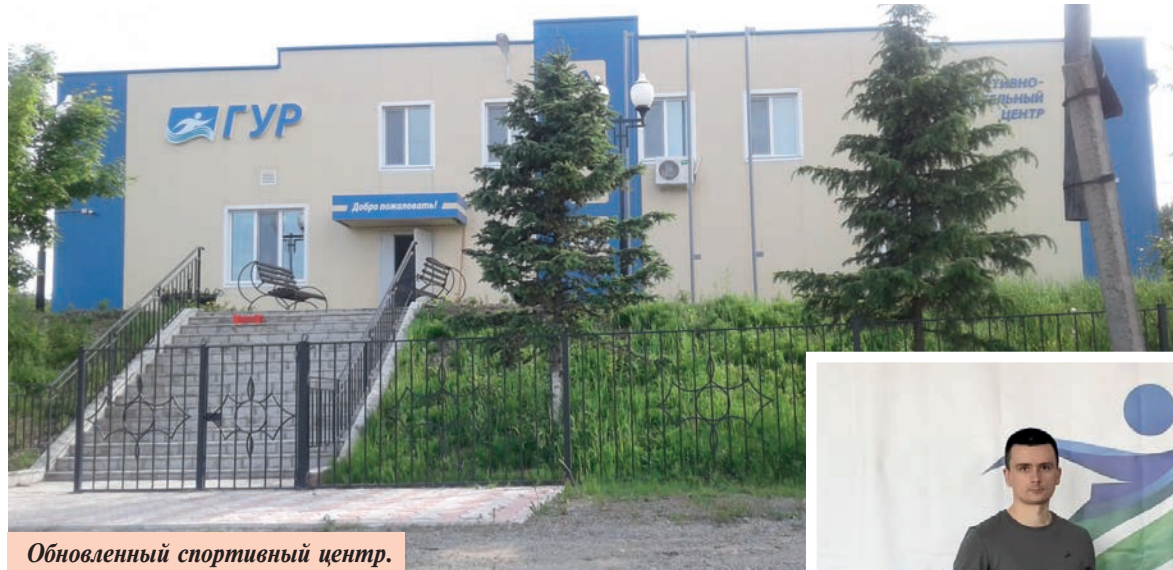
Обновленный спортивный центр.

В этом году мы с гордостью отмечаем солидный возраст нашего Комсомольского района. И по сравнению с ним спортивный центр Снежного, о котором сегодня пойдет речь, еще молод, но уже и не юн. В марте ему исполнилось тридцать пять лет. И это возраст совершенства. Ведь за плечами уже богатый жизненный опыт, а впереди — еще столько новых свершений и побед!