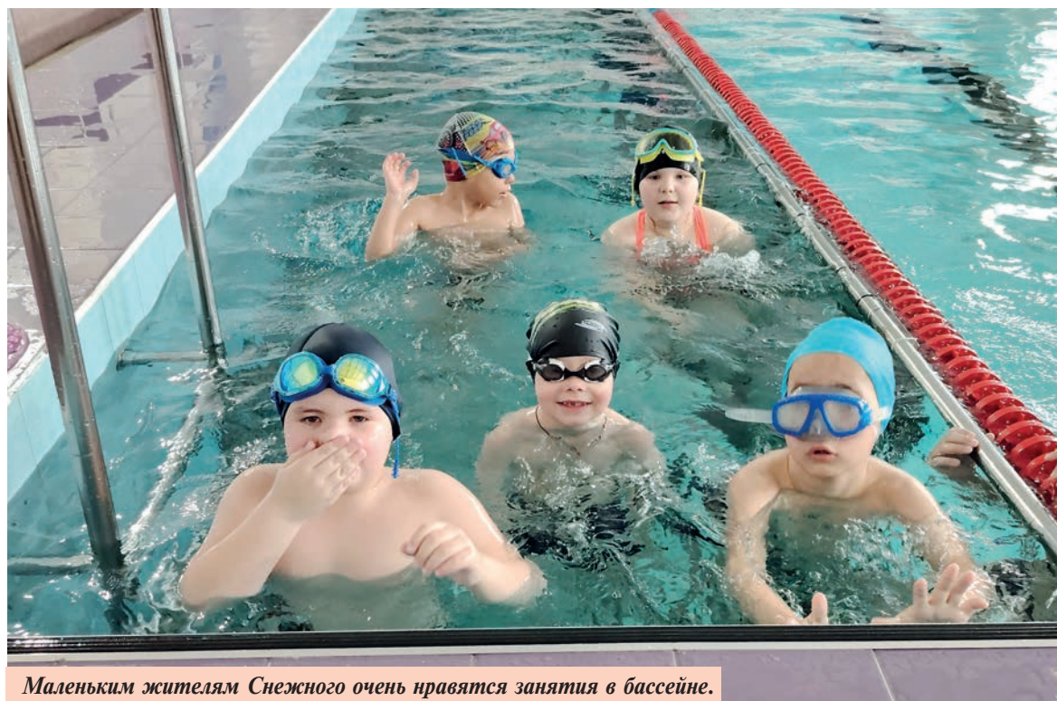
Маленьким жителям Снежного очень нравятся занятия в бассейне.

нес, аквааэробика, в тренажерном зале проводятся занятия по общей физической подготовке для детей и взрослых. Благодаря таким тренировкам рабочая молодежь сельского поселения выступает на соревнованиях