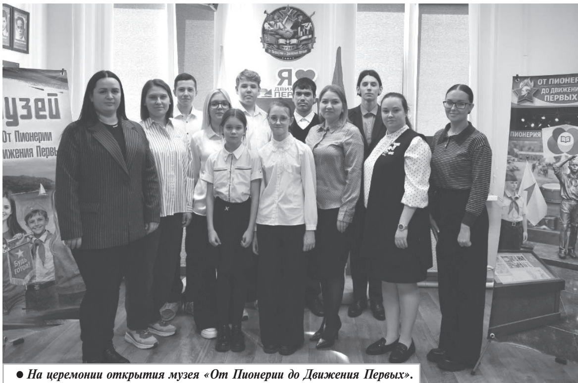
● На церемонии открытия музея «От Пионерии до Движения Первых».

Десятого марта в школе села Гайтер состоялось знаковое для всего нашего района событие — торжественное открытие музея «От Пионерии до Движения Первых».