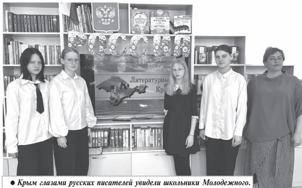
● Крым глазами русских писателей увидели школьники Молодежного.

Крым сыграл очень важную роль в жизни Марины Цветаевой, именно там юная поэтесса познакомилась с Сергеем Эфроном, который стал ее мужем.