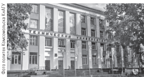
Фото политех Комсомольска КНАГУ

— Наши студенты уже с третьего курса не только проходят стажировку