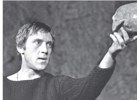
В. Высоцкий в роли Гамлета.

После школы Высоцкий поступил в школу-студию МХАТ, по окончании которой получил распределение в театр имени Пушкина, затем работал в театре миниатюр. Он играл небольшие роли, эпизоды и чувствовал колоссальную неудовлетворенность самим собой. Но если бы не было этой невостребованности в театре, возможно, не появились бы песни Высоцкого, которые он начал писать в 1961 году. Друзья записывали его песни на магнитофонные ленты, и вскоре уже почти в каждом доме нашей огромной страны звучал голос Высоцкого.