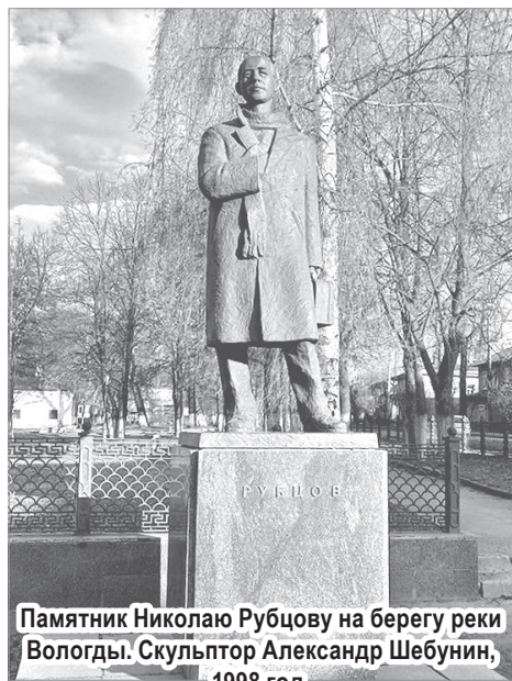
Памятник Николаю Рубцову на берегу реки Вологды. Скульптор Александр Шебуниев, 1998 год.