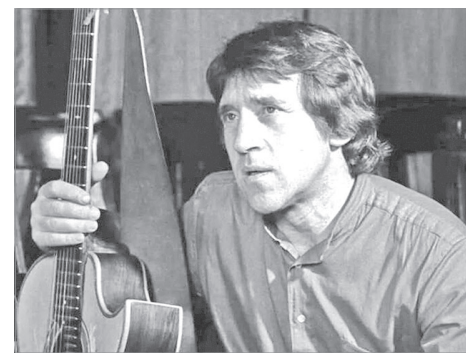
В. Высоцкий на телевидении

Летом 1964-го у Высоцкого произошла встреча, определившая всю его дальнейшую судьбу: друзья посоветовали ему показаться главному режиссеру театра на Таганке Юрию Петровичу Любимову. Он говорил о В. Высоцком: «То, что он был замечательный поэт, - это я разнюхал сразу, мне не нужны были никакие рекомендации. Он пришел и пел мне 45 минут».