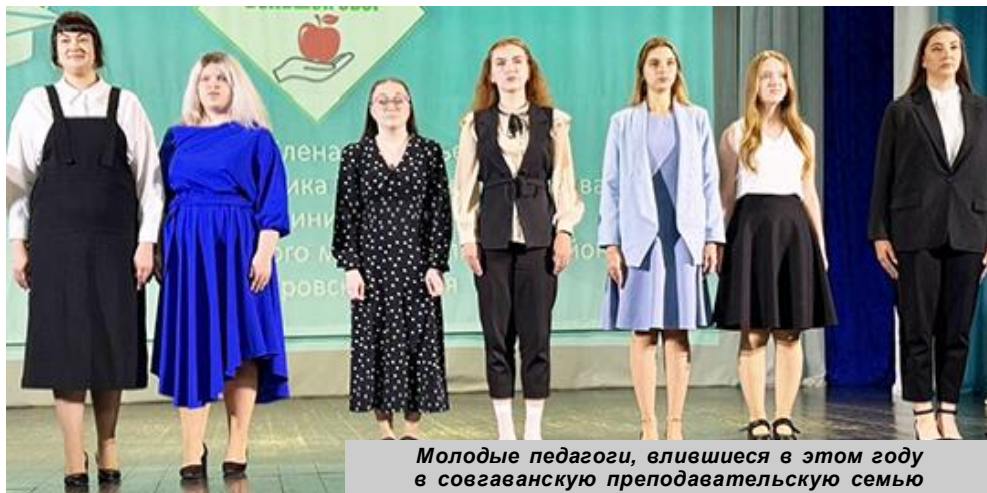
Молодые педагоги, вливающиеся в этот год в совгаванскую преподавательскую семью

"Наше волонтерское движение набирает обороты.