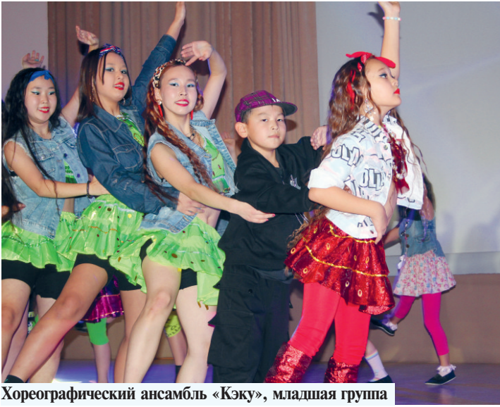
Хореографический ансамбль «Кэку», младшая группа