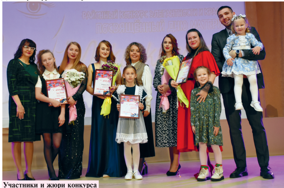
Участники и жюри конкурса