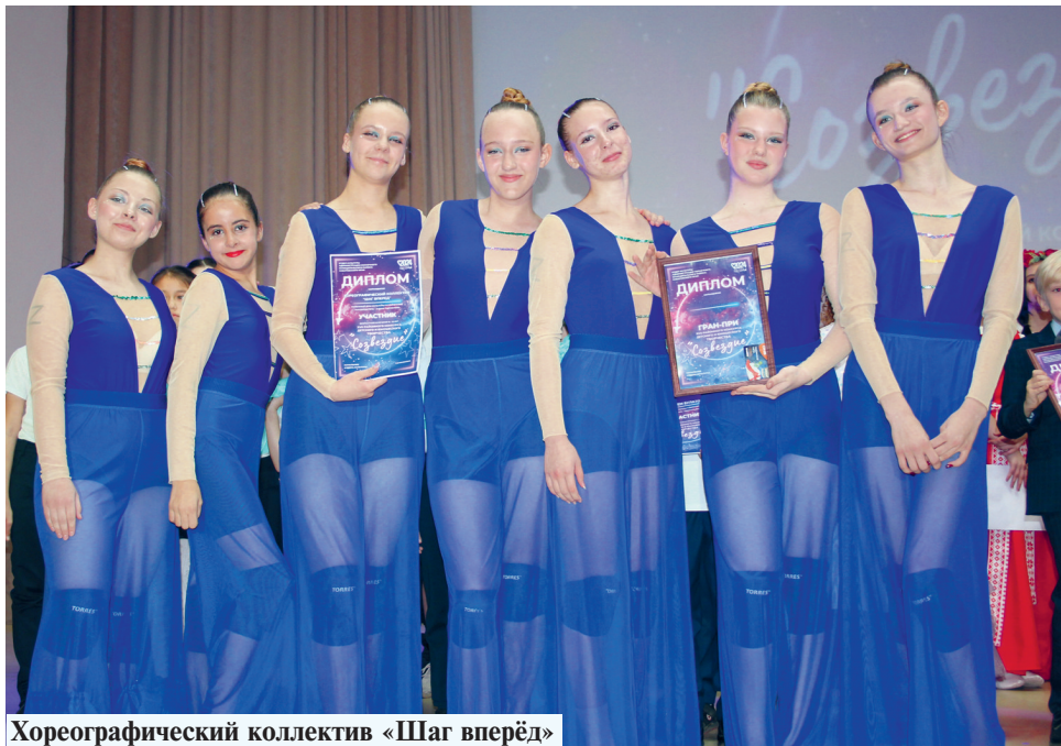
Хореографический коллектив «Шаг вперёд»

Благодарные зрители щедро одарили аплодисментами многочисленные