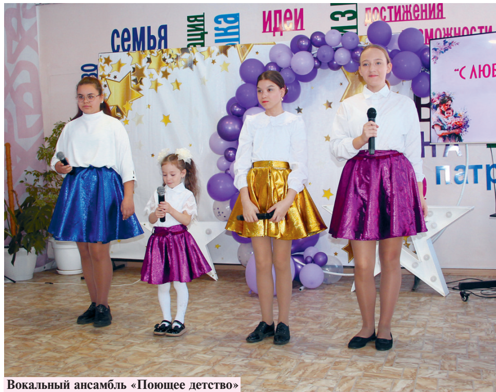
Вокальный ансамбль «Поющее дет-

ство» подарили гостям песню «Мама, будь всегда со мною рядом».