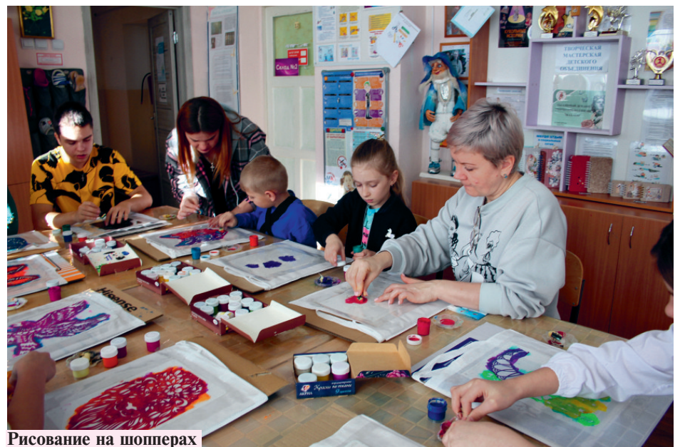
Рисование на шопперах

УЧРЕДИТЕЛИ: Администрация Солнечного муниципального района Хабаровского края, Комитет по информационной политике и массовым коммуникациям Правительства Хабаровского края. ГЛАВНЫЙ РЕДАКТОР: С.Н. БУРЛИНА Адрес редакции, издателя: 682711, р.п. Солнечный Хабаровского края, ул. Ленина, 23, 2-й этаж.