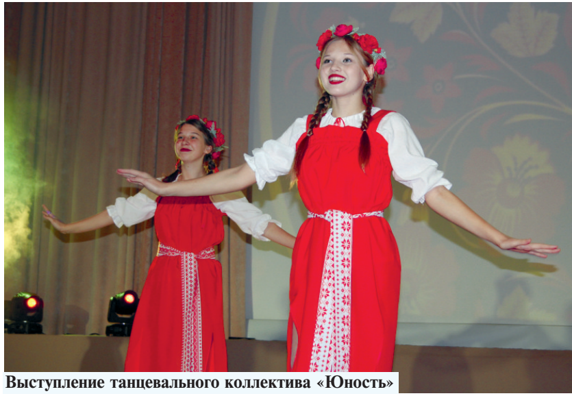
Выступление танцевального коллектива «Юность»