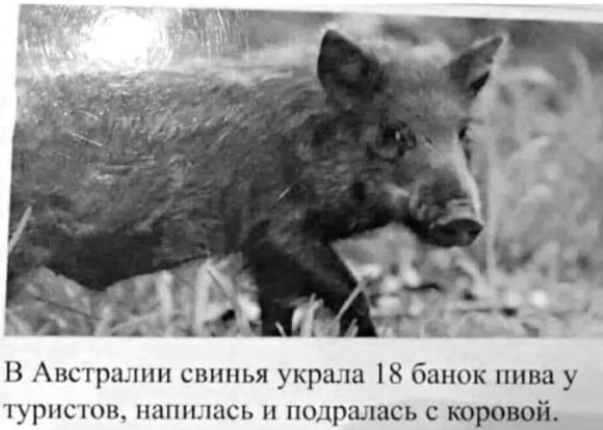
В Австралии свинья украла 18 банок пива у туристов, напилась и подралась с коровой.