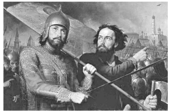
«Минин и Пожарский», Михаил Скотти, 1850 год

После событий 1612 года Русская православная церковь установила праздник в честь Казанской иконы Божьей Матери, который отмечался 4 ноября (22 октября по старому стилю). Этот день стал церковным праздником, символизирующим благодарность Богородице за избавление от иноземных захватчиков. В этот день проводились торжественные богослужения, крестные ходы и народные гуляния.