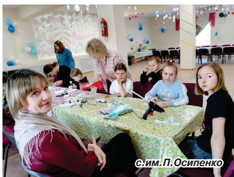
с.им. П. Осипенко