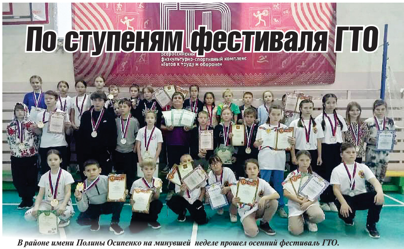
В районе имени Полины Осипенко на минувшей неделе прошел осенний фестиваль ГТО.

Муниципальный осенний фестиваль ВФСК ГТО проходил 23 ноября на базе средней школы села им.П.Осипенко среди спортсмен-школьников II, III и IV ступени.