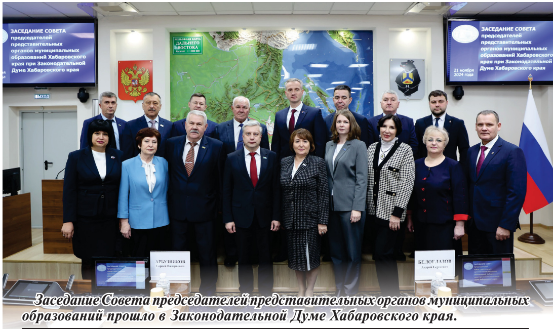
Заседание Совета председателей представительных органов муниципальных образований прошло в Законодательной Думе Хабаровского края.