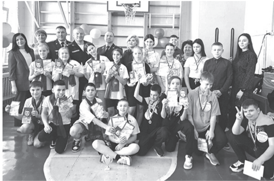
Всегда вместе с молодёжью и ветеранами