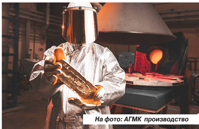
На фото: АГМК производство