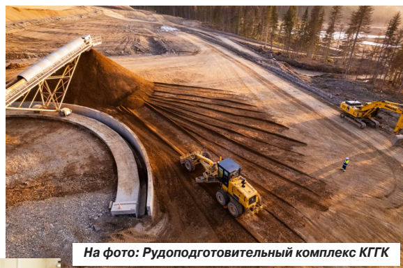
На фото: Рудоподготовительный комплекс КГТК

с папой ходили по горам, по лесам. И когда я приехала на Кутын, была просто в восторге: мое окно здесь выходит на лес, на сопки. Всевозможные краски осенью, потрясающие закаты, море видно. Словами не передать. Это красота, которая наполняет и вдохновляет.