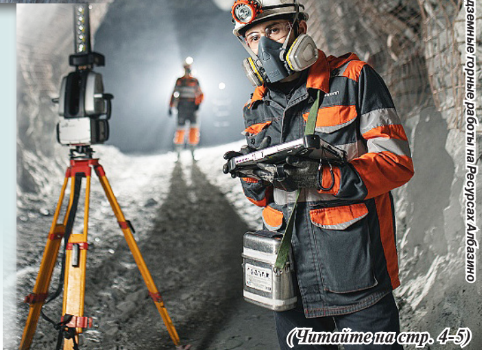
На фото: Полевые горные работы на Ресурсах Албазино

«Полиметалл»- это тысячи людей, объединенных общей целью. Это те, кто карабкается в туманные горы, водит спецмашины, взрывает каменную твердь и смотрит в окуляры микроскопов, кто ориентируется в коридорах рудников, трудится на новейших, уникальных производствах – и, конечно же, любит свое дело. В день рождения компании расскажем, как золото Хабаровского края и предприятия «Полиметалла» соединяют судьбы удивительных людей.