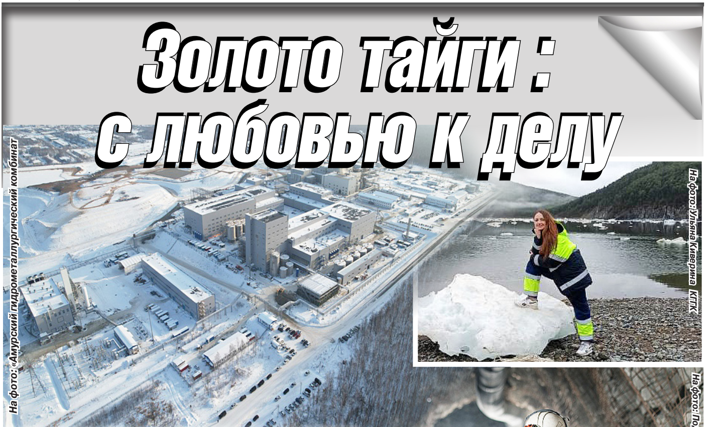
На фото: «Амурский гидрометаллургический комбинат»