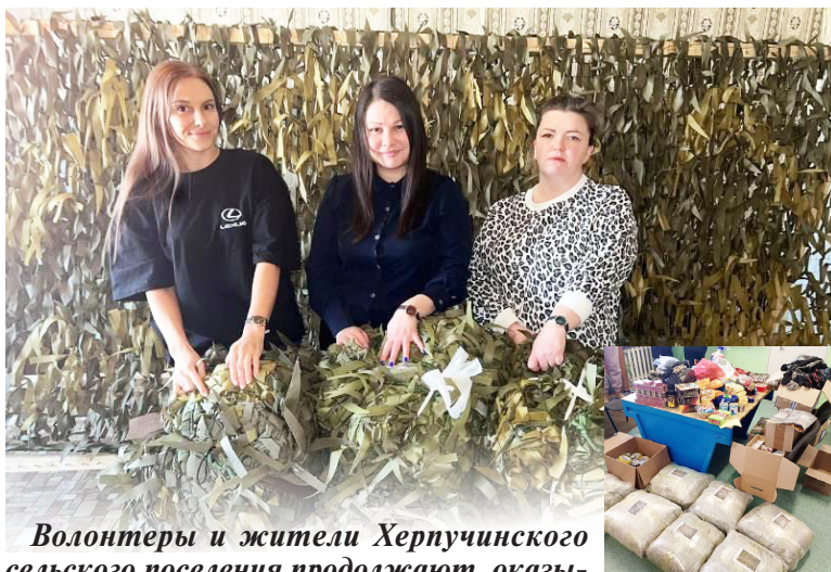
Волонтеры и жители Херпучинского сельского поселения продолжают оказывать гуманитарную помощь участникам специальной военной операции.