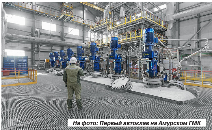
На фото: Первый автоклав на Амурском ГМК