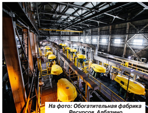
На фото: Обогащительная фабрика Ресурсов Албазино

Ну а мы перемещаемся на «Ресурсы Албазино». Здесь, у инженера производ-