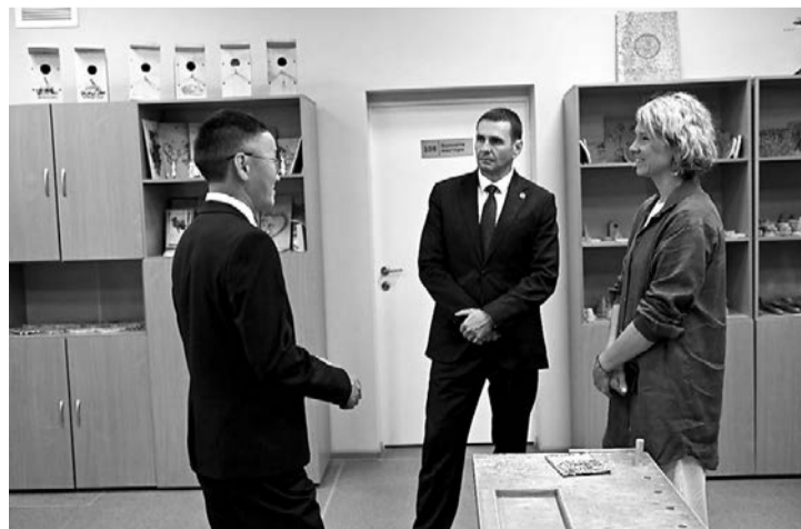
Дмитрий Демешин и Оксана Лут в школе села Мичуринского

В ходе рабочей поездки в Хабаровский край министр сельского хозяйства Оксана Лут провела встречу с врио губернатора Дмитрием Демешиним, а также посетила новую школу имени В.К. Арсеньева в селе Мичуринском Хабаровского района.