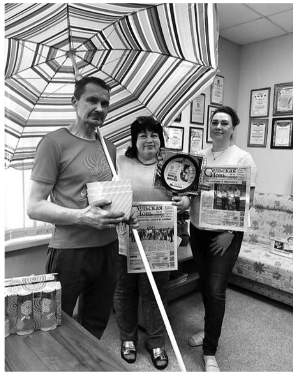
Коллектив Дома культуры с. Тополева

тематических страничках газеты тоже размещается много полезной информации.