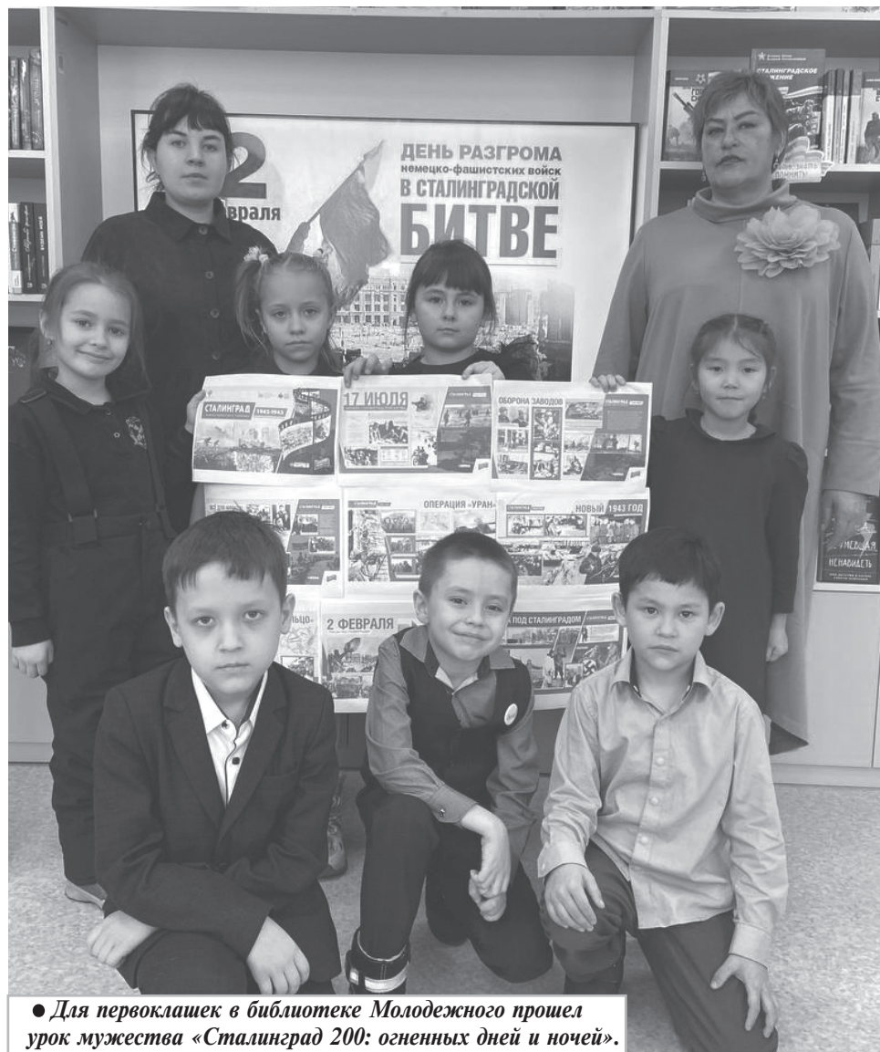
● Для первоклашек в библиотеке Молодежного прошел урок мужества «Сталинград 200: огненных дней и ночей».

Сталинградская битва стала переломным моментом Второй мировой войны, ознаменовав по словам товарища Сталина закат немецко-фашистской армии. И после этого сражения вермахт уже не смог восстановить свои силы.