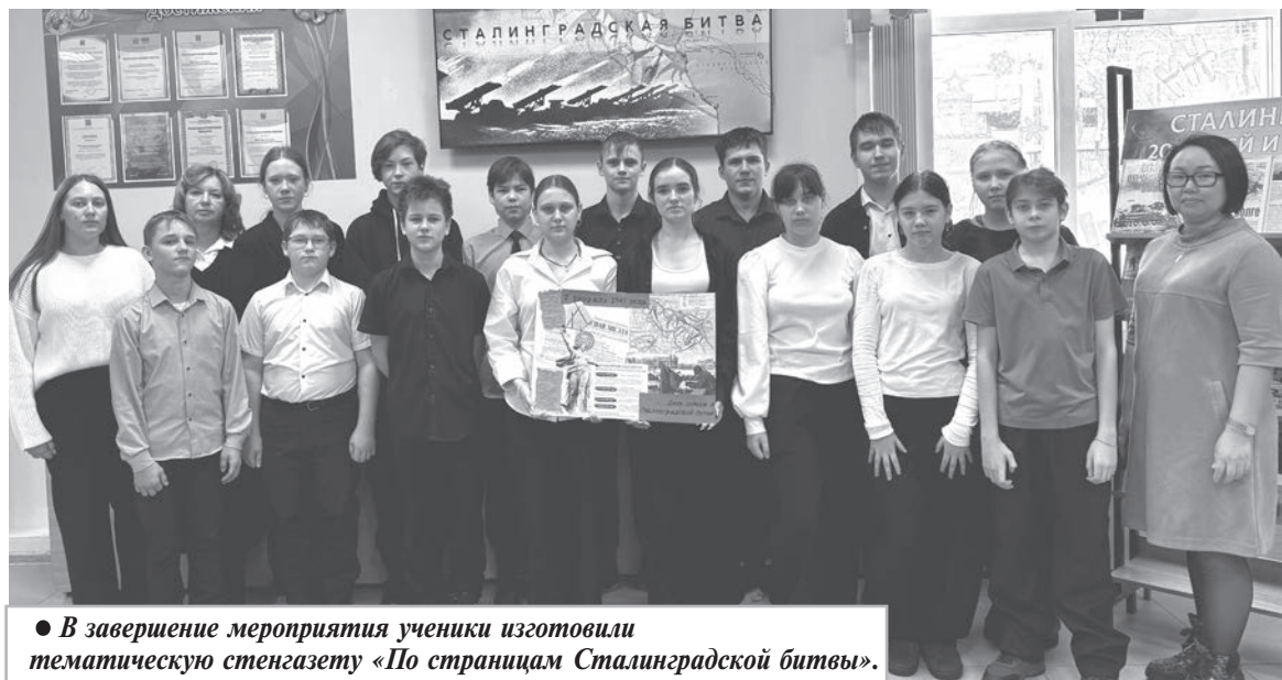
● В завершение мероприятия ученики изготовили тематическую стенгазету «По страницам Сталинградской битвы».

С большим интересом ребята посмотрели документаль-