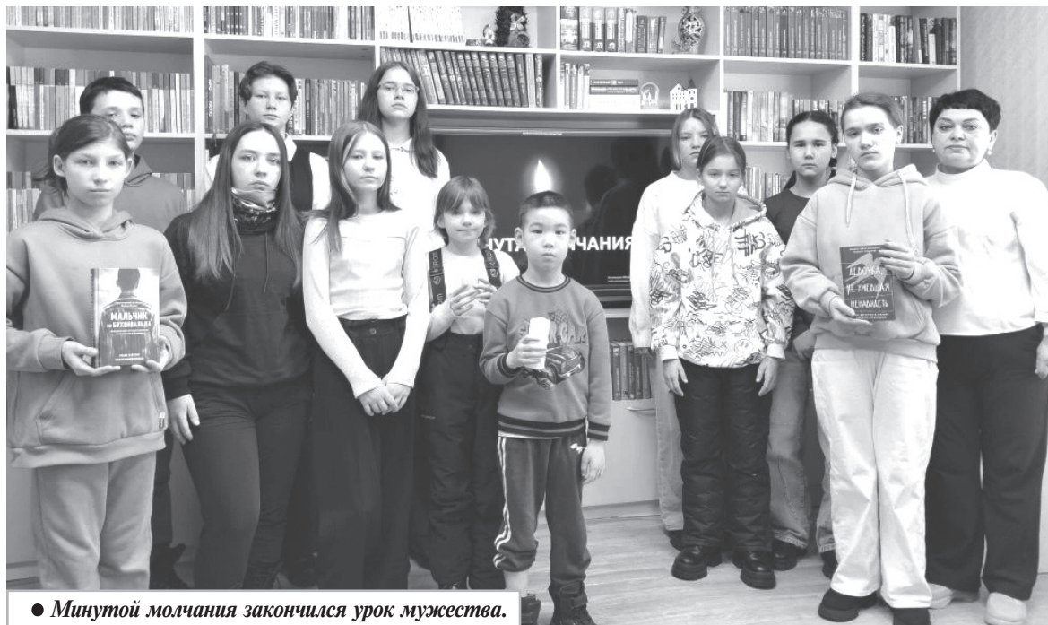
● Минутой молчания закончился урок мужества.

В Комсомольском районе во всех учреждениях культуры, школах и библиотеках продолжают мероприятия в рамках мирно-патриотического месячника, цель которого — воспитание патриотизма у подрастающего поколения на героических подвигах и традициях русского народа.