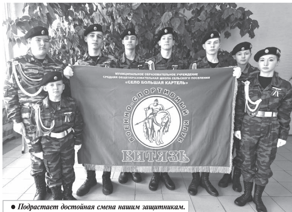
● Подрастает достойная смена нашим защитникам.

Давно канули в лету времена, когда древнерусским витязям для владения булатным мечом и копьем требовалась в основном недюжинная физическая сила и выносливость. Современные вызовы и угрозы национальной безопасности Российской Федерации требуют полной адаптации силовых структур к реалиям сегодняшнего дня. Российским военнослужащим наряду с отличной боевой и физической подготовкой не менее важна и техническая. Владение новейшими компьютерными программами и технологиями помогает им оперативно решать тактические и стра-