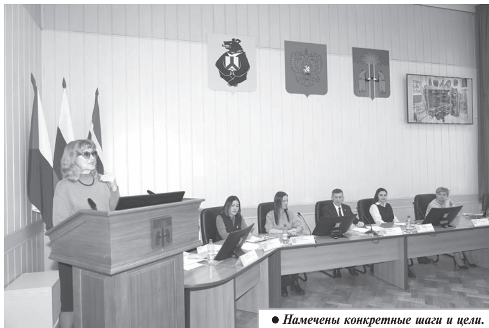
● Намечены конкретные шаги и цели.

Несомненно, что одной из территорий притяжения в селе станет историко-этнографический парк, работа по его созданию активно продолжается.