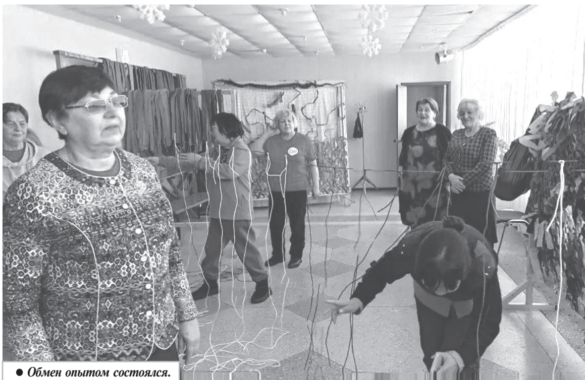
● Обмен опытом состоялся.