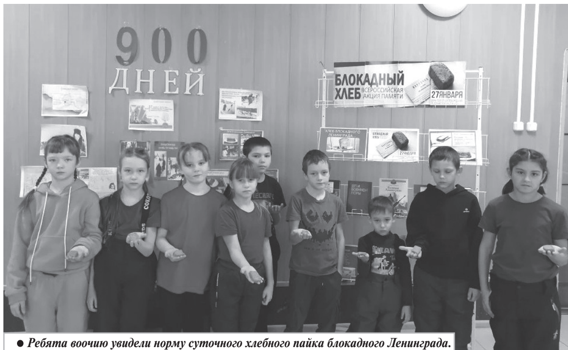
● Ребята воочию увидели норму суточного хлебного пайка блокадного Ленинграда.

В библиотеке Галичного сельского поселения прошло мероприятие «Блокадный хлеб».