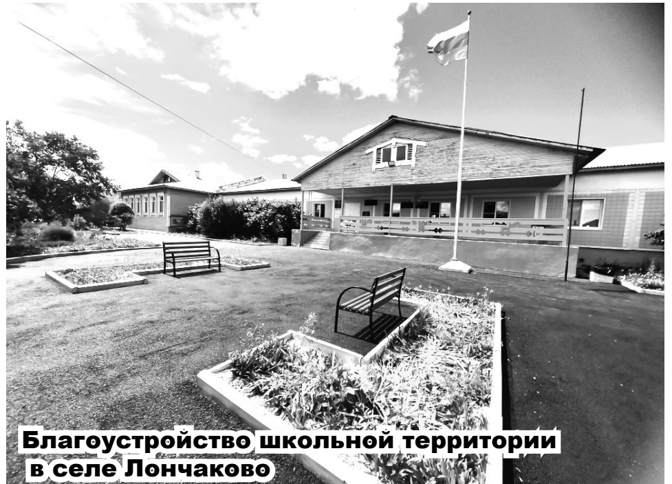
Благоустройство школьной территории в селе Лончаково

Для конкурсного отбора в министерство сельского хозяйства и продовольствия Хабаровского края от округа было отправлено 16 проектов почти на 49 миллионов рублей. Результаты конкурса я вам назвала, но мы не намерены отказываться от подготовленных проектов, пересчитаем сметы и вновь выйдем