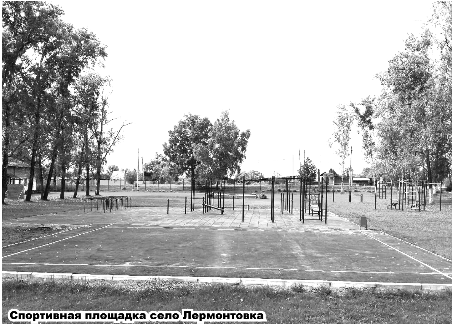
Спортивная площадка село Лермонтовка

включает, кроме нового ограждения территории детсада, монтаж системы уличного освещения, обновление оборудования двух детских площадок, их покроют специальным, безопасным покрытием из