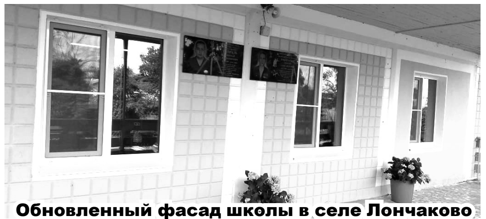
Обновленный фасад школы в селе Лончаково