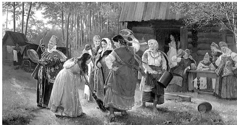
Фото картины Алексея Корзухина. Девичник, 1889 год. Государственный русский музей, Санкт-Петербург

Несмотря на строгость нравов, принятых среди молодёжи, русские свадьбы отличались широким размахом. Подготовка к свадебному торжеству включала несколько важных этапов. Первым этапом был сговор, где родители жениха и невесты через сватов обсуждали будущее соединение их детей. Затем следовало рукобитье – официальная договорённость между семьями в присутствии свидетелей, нарушение которой считалось серьёзным грехом и оскорблением. После этого начиналась основная подготовка к венчанию, включающая решение бытовых вопросов, девичники и мальчишники. В день свадьбы жених прибывал к дому невесты с выкупом и подарками для неё и её матери. Само венчание проводилось в установленный день