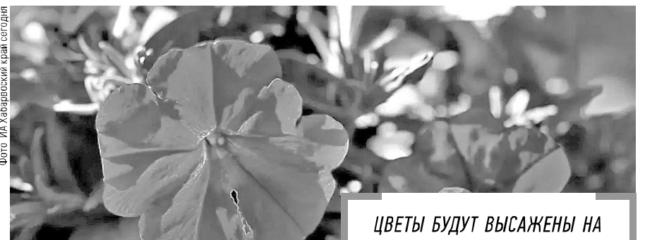
ЦВЕТЫ БУДУТ ВЫСАЖЕНЫ НА ПЛОЩАДИ БОЛЕЕ ТЫСЯЧИ КВАДРАТНЫХ МЕТРОВ.

Администрация Комсомольска-на-Амуре начала работу по подготовке к предстоящему летнему сезону, объявив закупку на комплексное озеленение городских пространств.