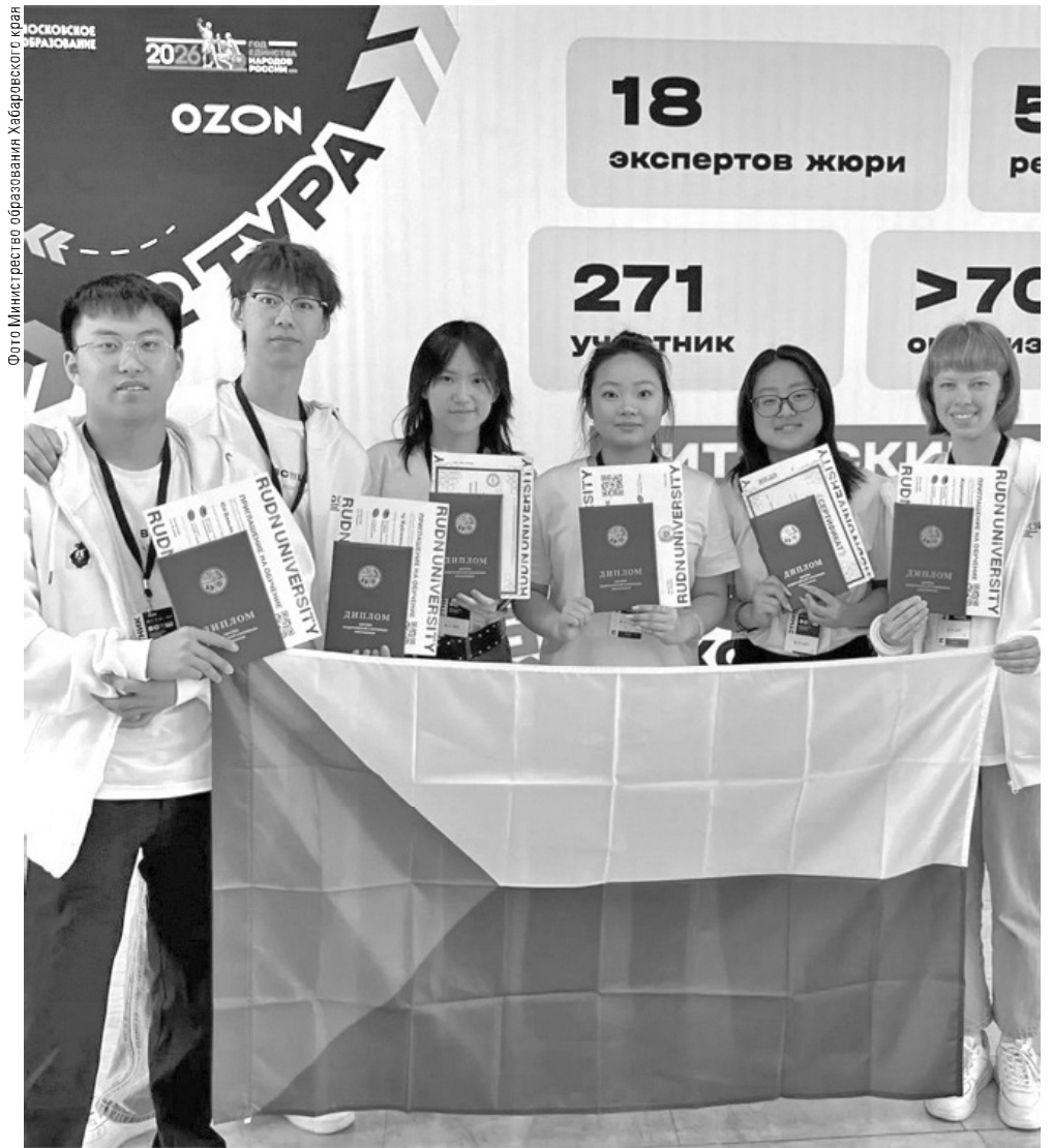
В УСТНОМ ТУРЕ ОНИ ПОКАЗЫВАЛИ УРОВЕНЬ РАЗГОВОРНОЙ РЕЧИ, СПОСОБНОСТЬ ПРОИЗНЕСТИ РЕЧЬ НА КИТАЙСКОМ ЯЗЫКЕ.

Дипломы победителей и призеров олимпиады, действующие четыре года, дают право поступления в ведущие российские вузы без вступительных испытаний по соответствующему профилю. В Хабаровском крае такие ребята ежегодно награждаются денежной премией имени генерал-губернатора Н.И. Гродекова.