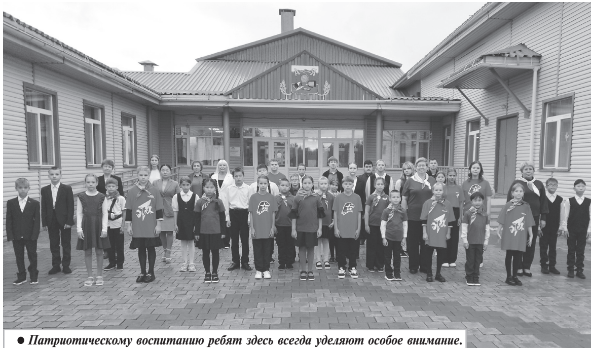
● Патриотическому воспитанию ребят здесь всегда уделяют особое внимание.

Право носить его имя коллектив школы, ученики и родители доказывали делом почти 30 лет: вели кропотливую поисковую работу, собирали архивные материалы, налаживали связь с родственниками героя. Его имя объединило историю школы с историей Великой Победы. Центральная улица села носит его имя, а главная экспозиция школьного музея рассказывает о его жизни и подвиге.