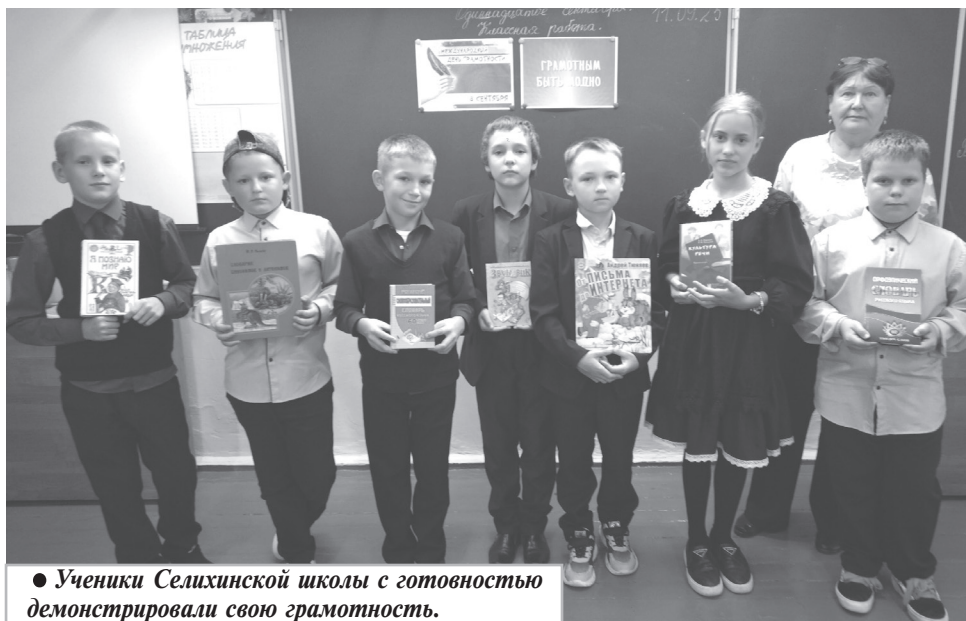
● Ученики Селихинской школы с готовностью демонстрировали свою грамотность.

Л. ПОРОШИНА, библиотекарь Селихинского сельского поселения.