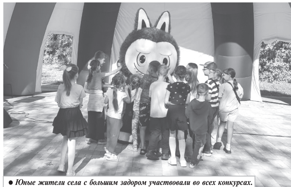
● Юные жители села с большим задором участвовали во всех конкурсах.

Н. НОЗДРАЧЕВА, режиссер массовых представлений.