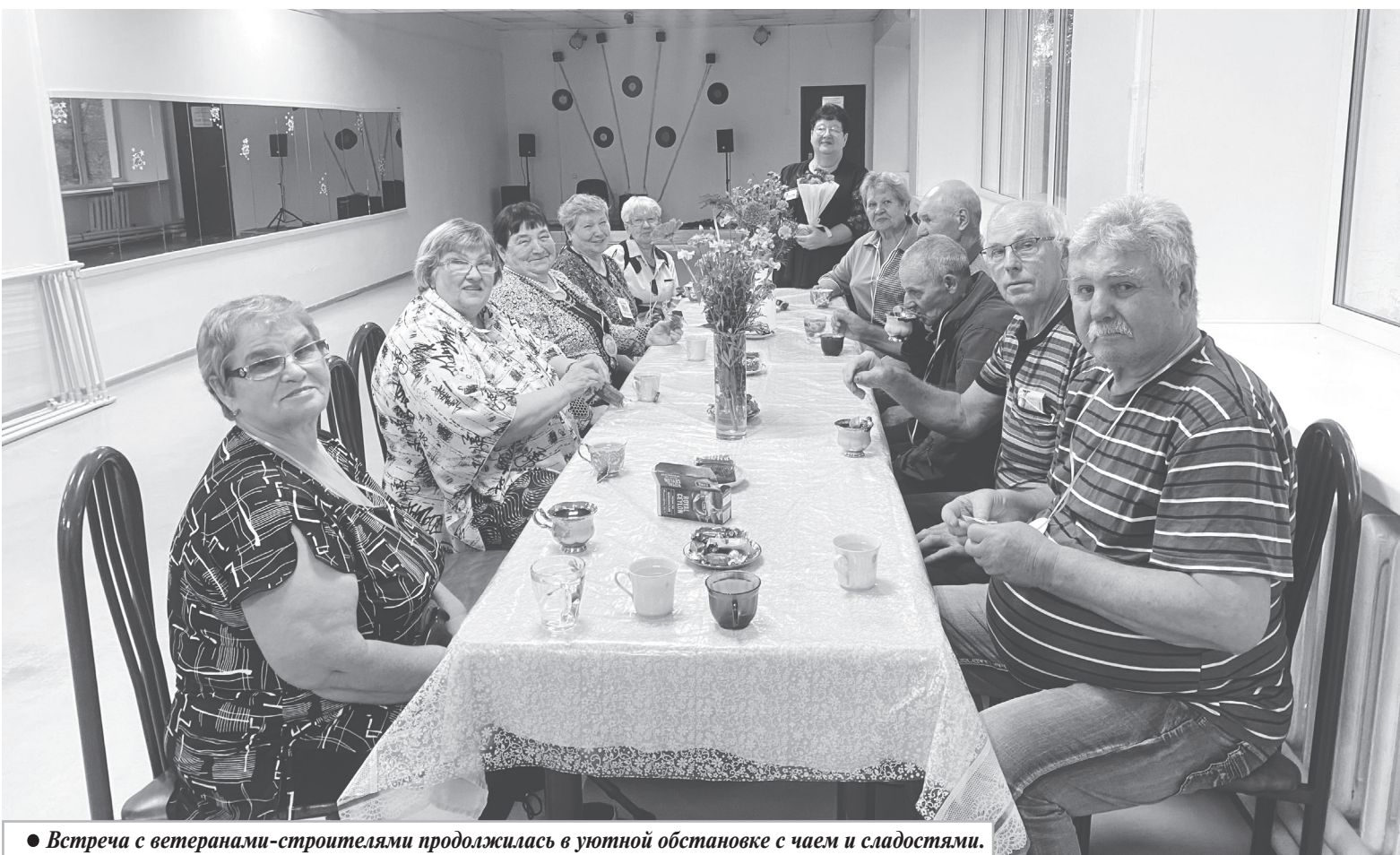
● Встреча с ветеранами-строителями продолжилась в уютной обстановке с чаем и сладостями.

Т. СУТУРИНА, специалист по методике клубной работы.