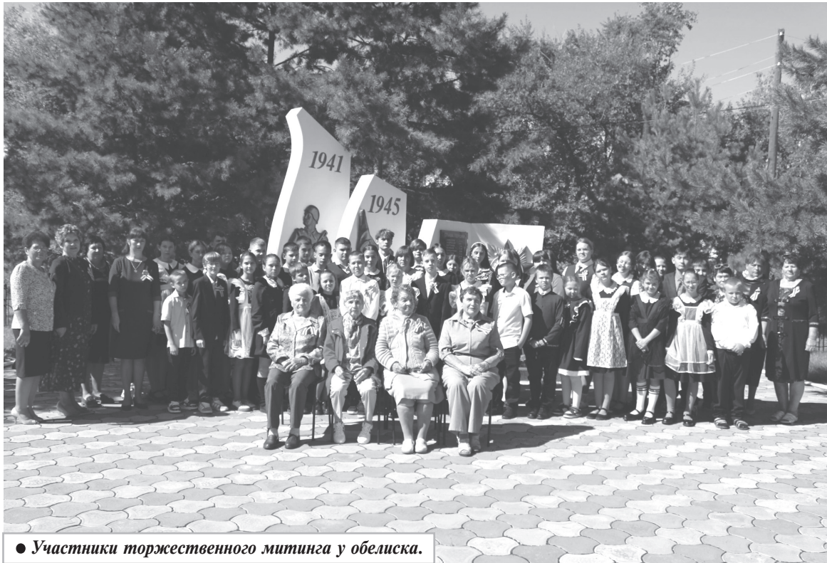
● Участники торжественного митинга у обелиска.

Также жители Молодежно присоединились к важной патриотической акции «Муа-