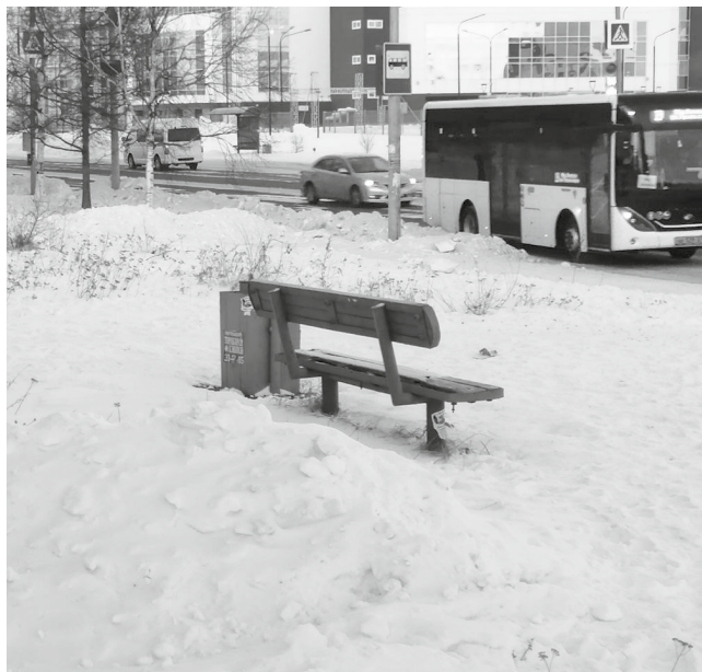
На остановке сиротливо стоит заваленная снегом и открытая всем ветрам скамейка