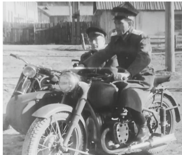
Служебный мотоцикл «Урал» — надёжный помощник советским милиционерам