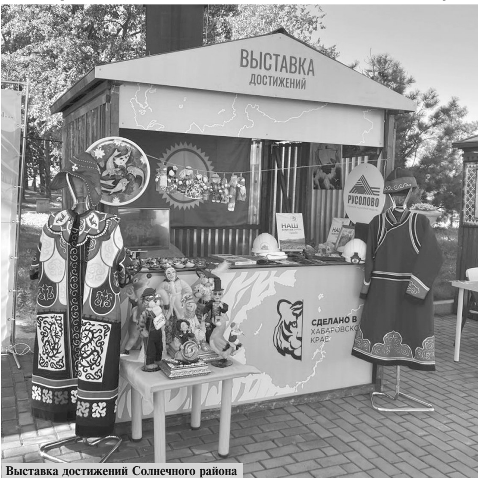
Выставка достижений Солнечного района