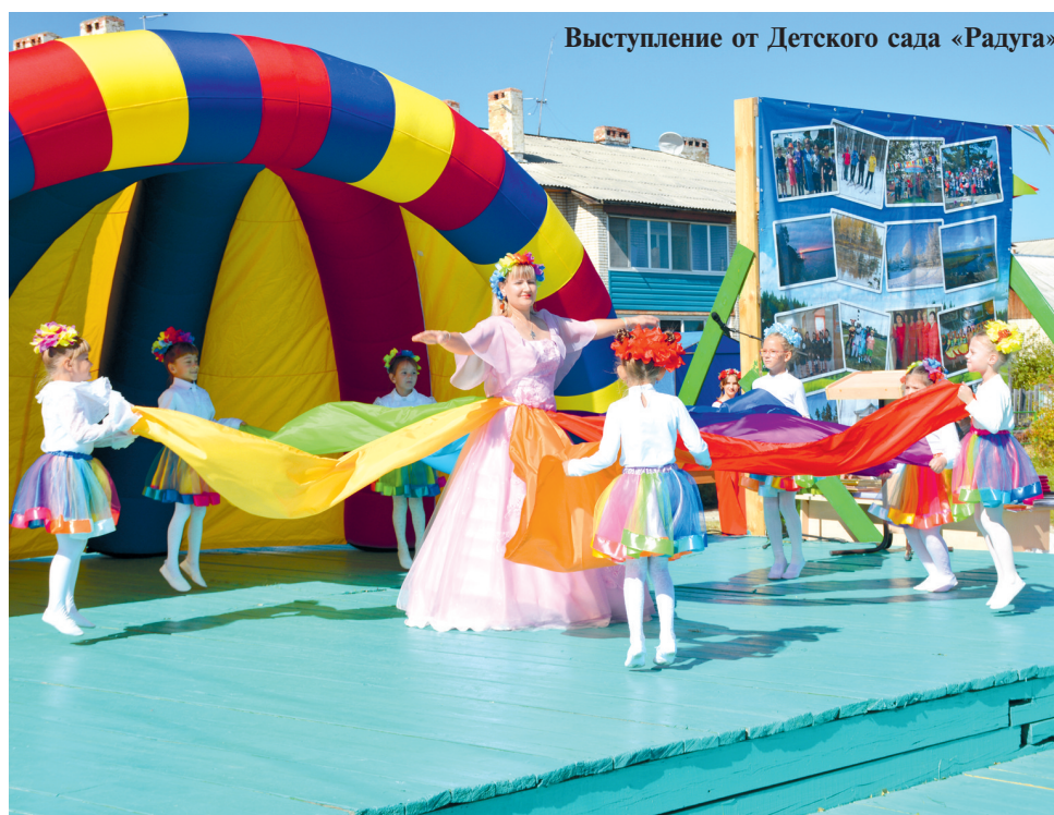
Выступление от Детского сада «Радуга»