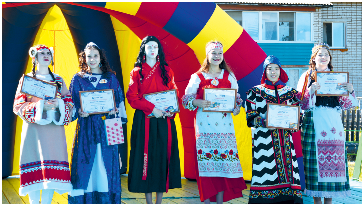
Участницы конкурса «Красота без границ»