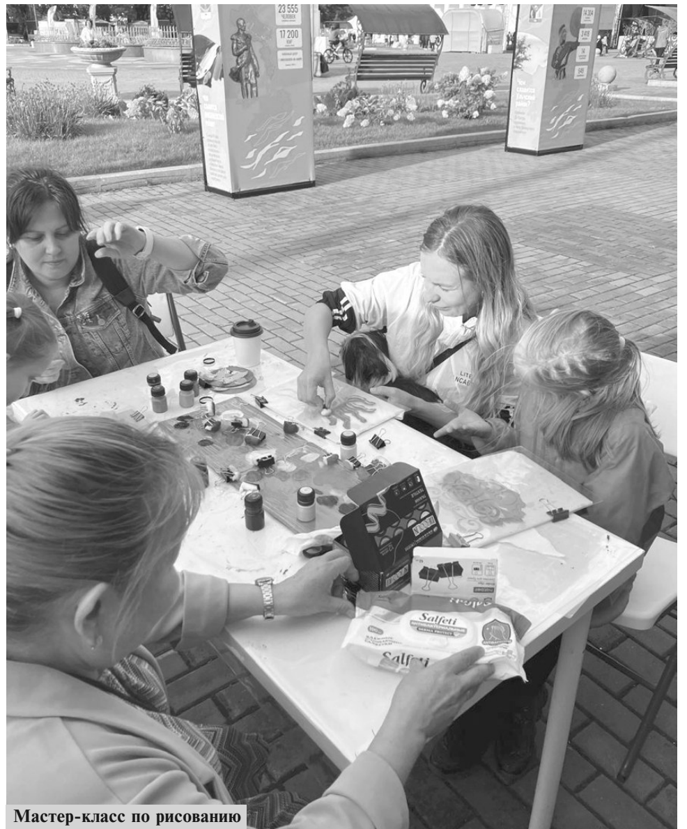
Мастер-класс по рисованию

Материал подготовила А. АНАНЬИНА