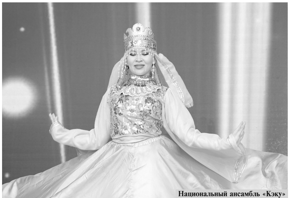
Национальный ансамбль «Кэку»