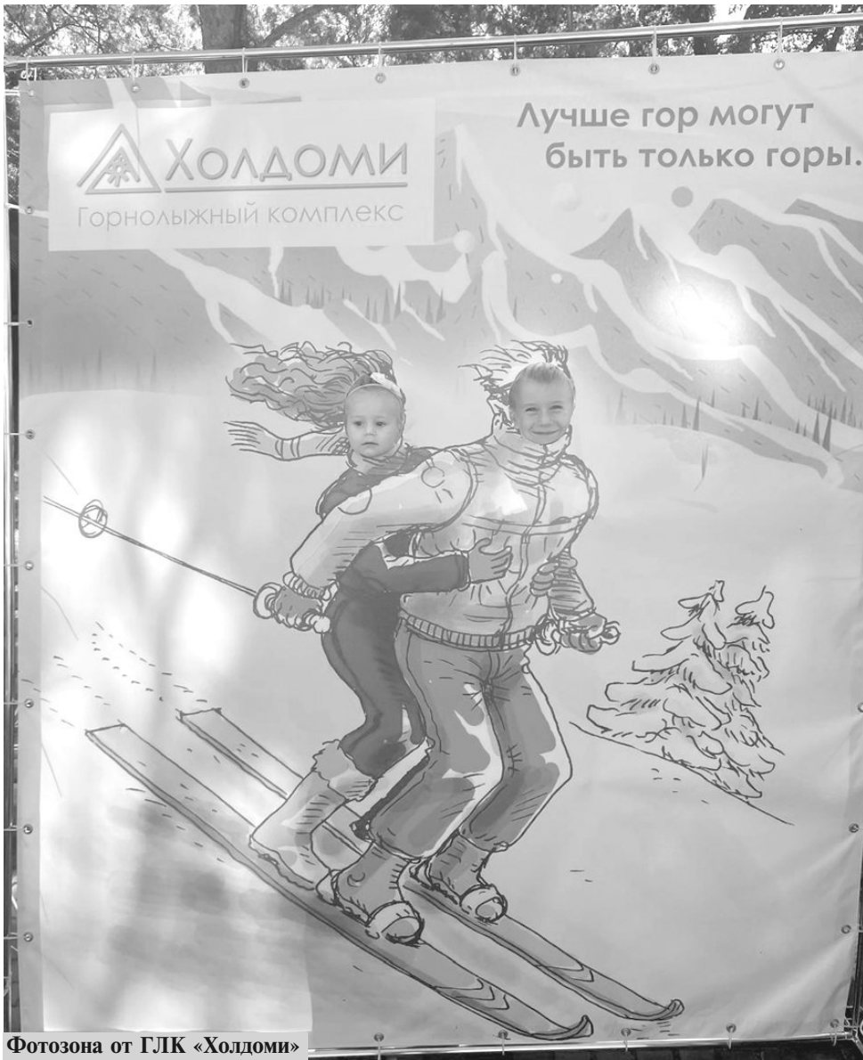
Фотозона от ГЛК «Холдоми»

сбудется, судя по тому, как на ветру развевается множество разноцветных ленточек.