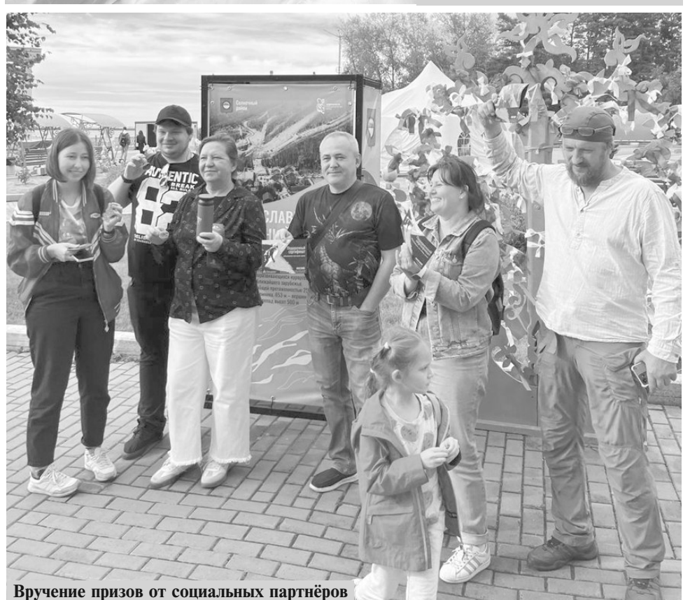
Вручение призов от социальных партнёров