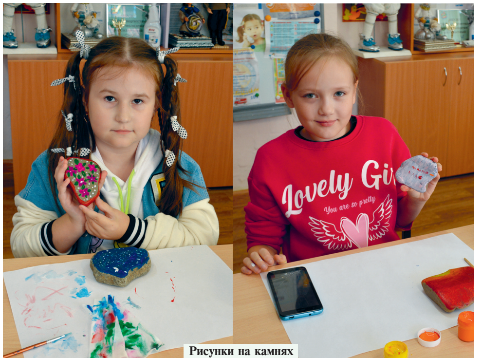
Рисунки на камнях