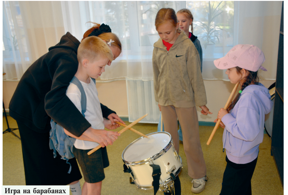
Игра на барабанах