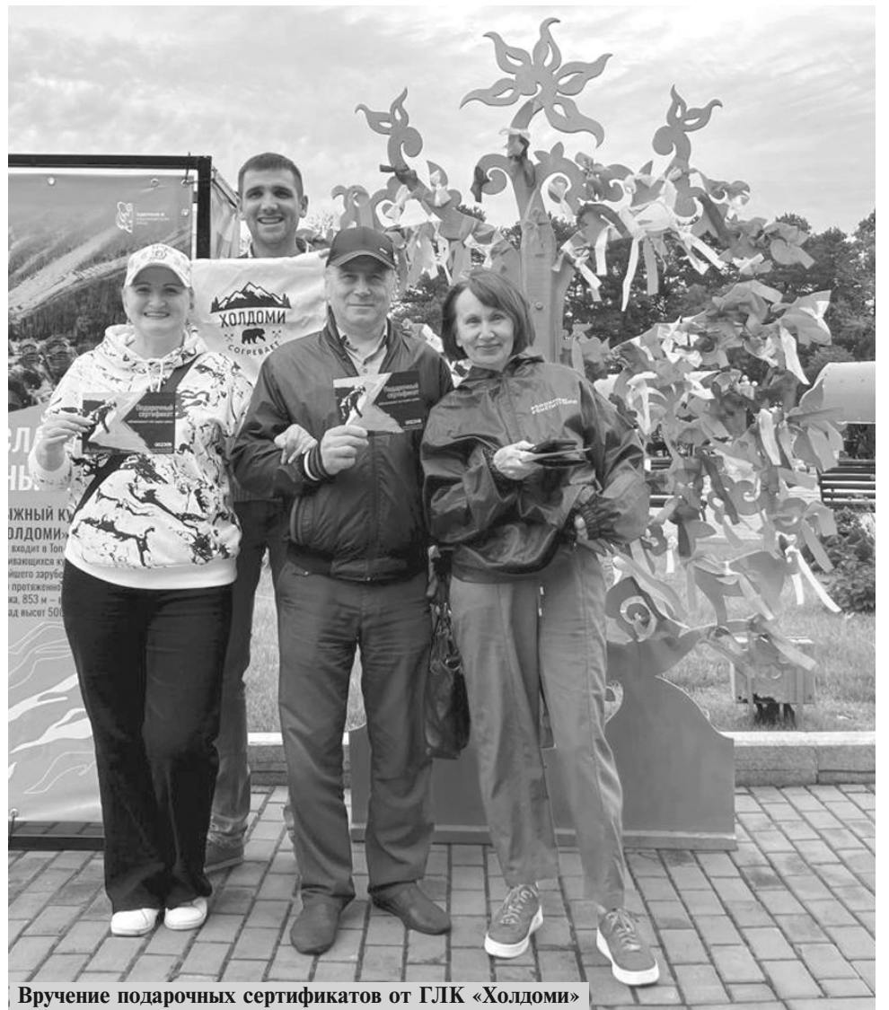
Вручение подарочных сертификатов от ГЛК «Холдоми»