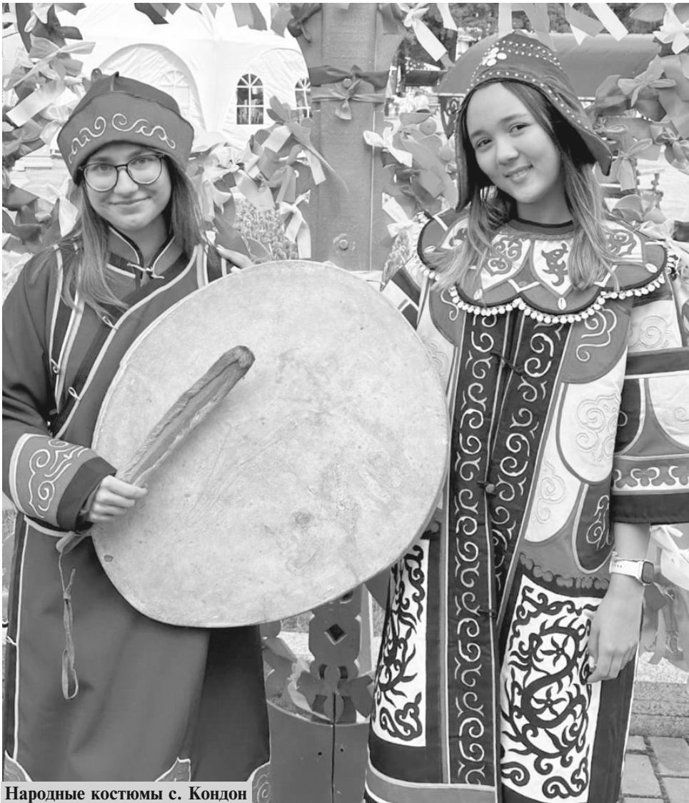
Народные костюмы с. Кондон