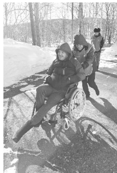
Прогулка с маломобильными

Особое место в их работе занимают культурные инициативы. Волонтеры организуют мини-концерты прямо в комнатах у тех, кто не может покинуть свою постель, создавая атмосферу праздника и тепла. Они не забывают поздравлять их с днём рождения и другими важными датами, вручая подарки от спонсоров. Кроме того, добровольцы помогают всем желающим постояльцам посещать онлайн-занятия со специалистами благотворительного фонда «Старость в радость», открывая для них новые возможности для обучения и общения.