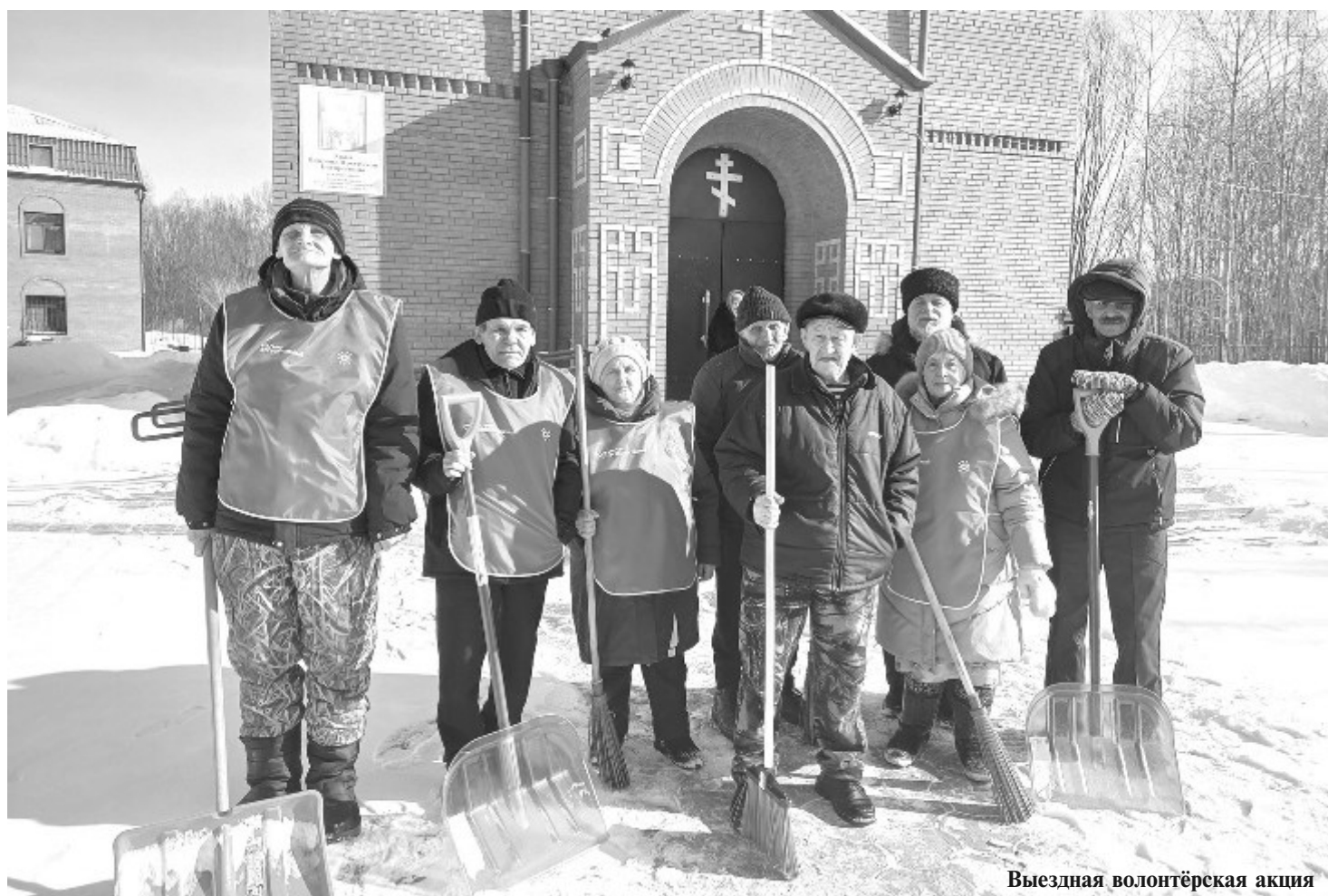
Выездная волонтерская акция