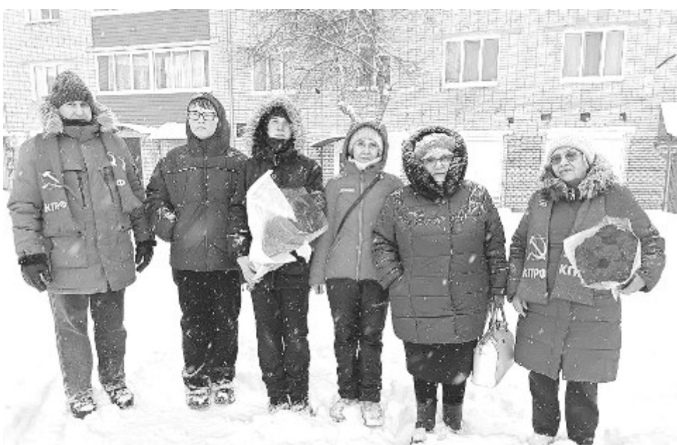
Активисты музея и представители КПРФ почтили память павших героев