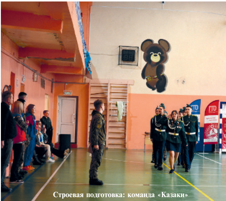
Строевая подготовка: команда «Казачи»

1 место - «Доблесть» (Центр творчества детей и молодёжи п. Солнечный);