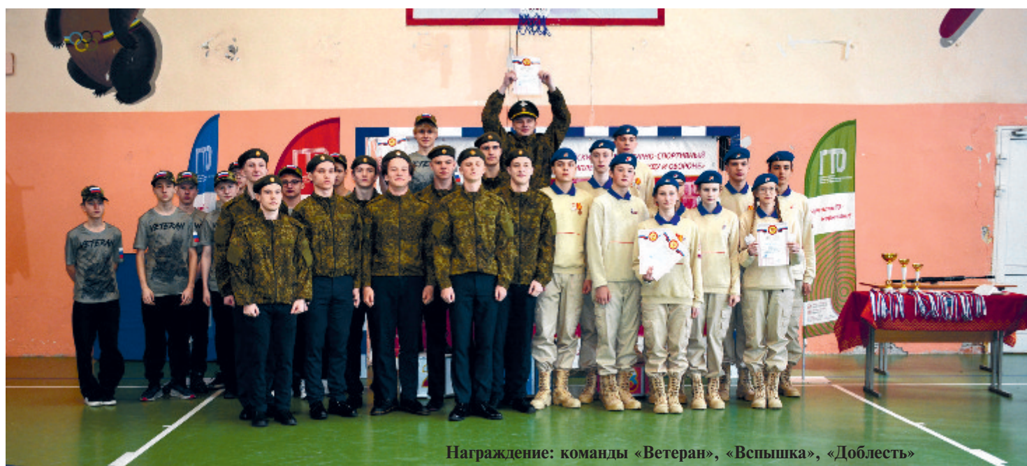
Награждение: команды «Ветеран», «Вспышка», «Доблесть»

2 место - «Вспышка» (средняя общеобразовательная школа № 3 п. Солнечный);