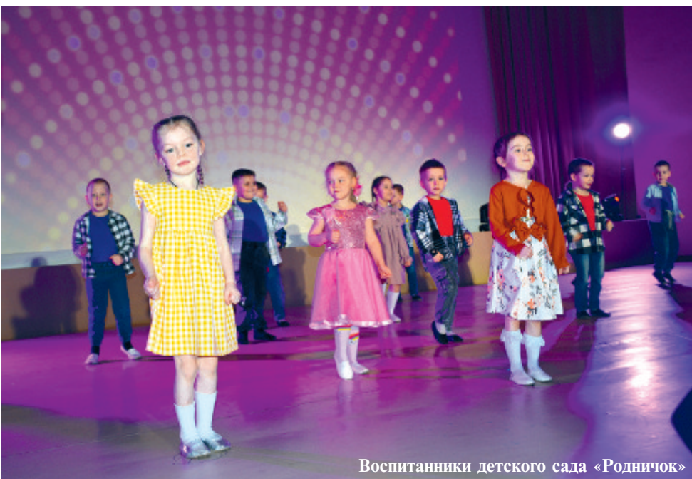
Воспитанники детского сада «Родничок»