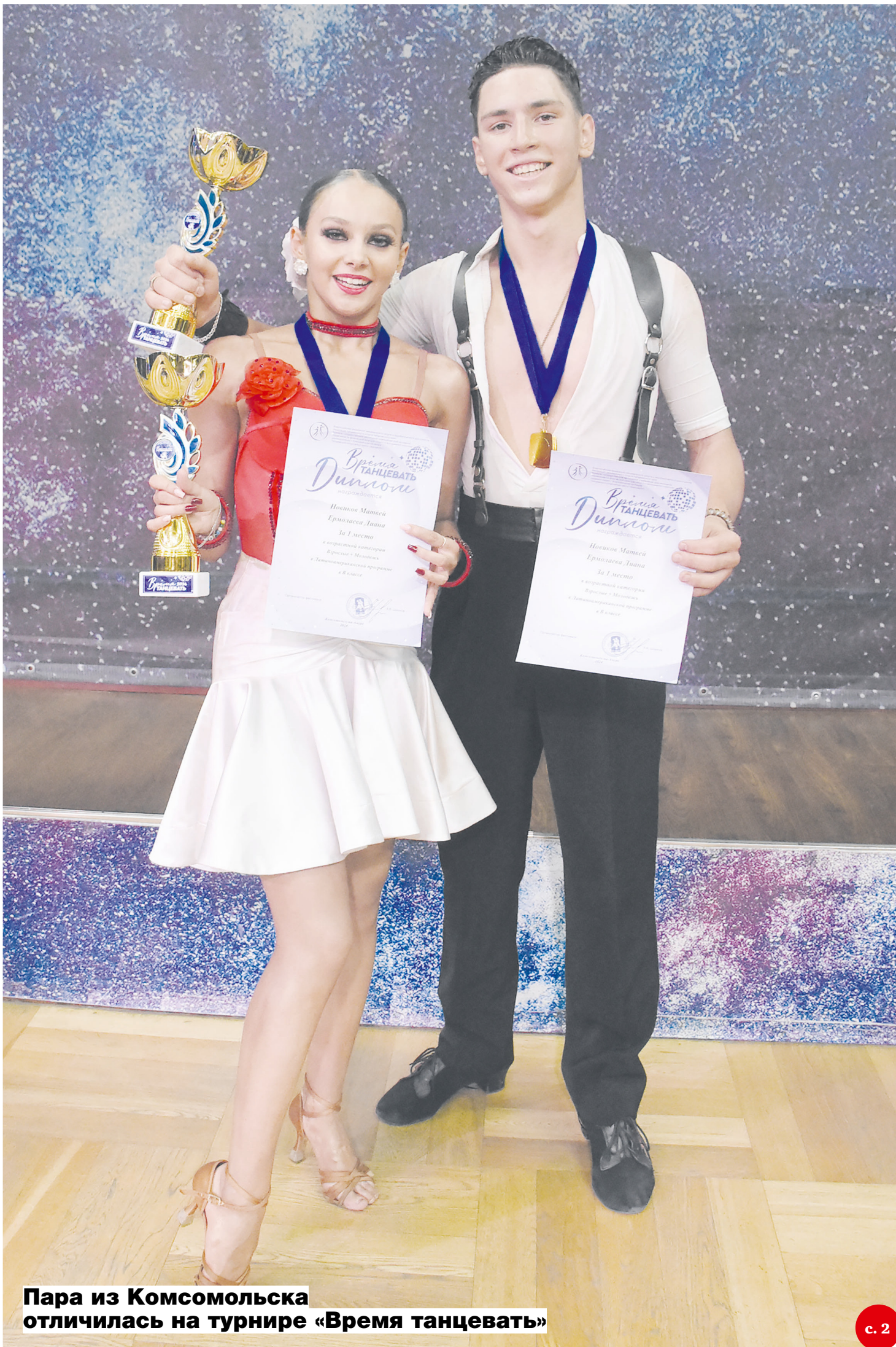
Пара из Комсомольска отличилась на турнире «Время танцевать»