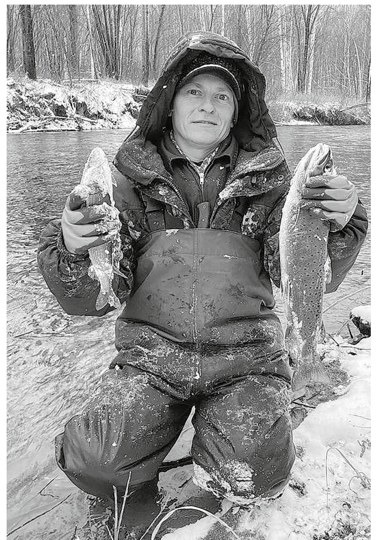
Хороша царская рыба!

До свиданья, открытая вода! Здравствуй, звонкий лёд!