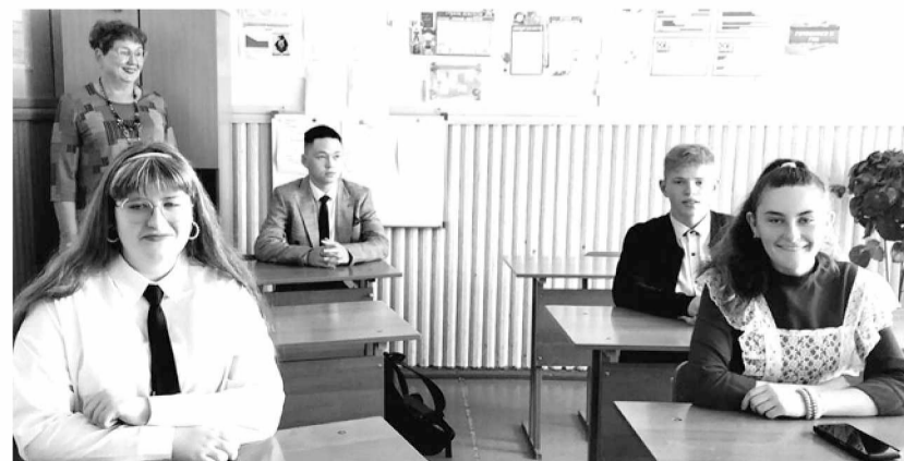
На уроке. "Дорогой открытий идём вместе!"